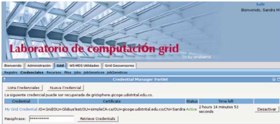
Figura 4. Recuperación de la credencial en el portal