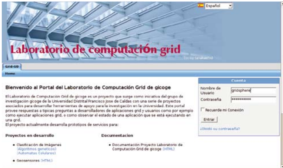
Figura 2. Página principal del portal grid para el Laboratorio de Computación Grid de Gicoge