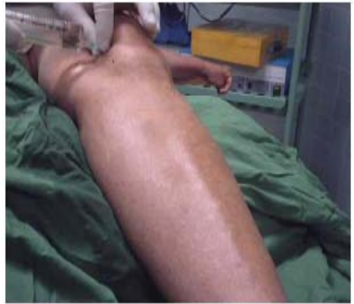
Figura 3. Inyección de bupivacaína en el portal superior interno.

En la piel y el tejido celular subcutáneo, a nivel del portal donde se introdujo el artroscopio se aplicó bupivacaína 5 ml al 0,25 %. Se esperaron 15 minutos para comenzar el proceder, previa prueba de analgesia de la zona. Se introdujo artroscopio preferentemente en el portal inferior externo.