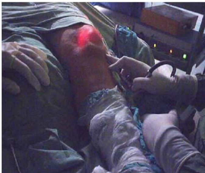
Figura 4. Punto de introducción del artroscopio.

Se cumplieron los cuidados propios del transoperatorio.