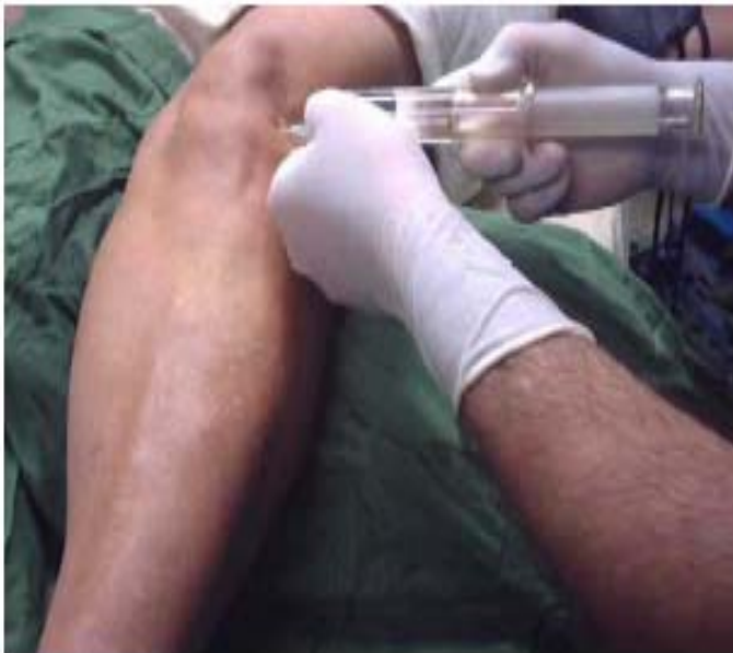
Figura 2. Inyección de bupivacaína en el portal superior externo.

Se inyectó en el espacio intraarticular bupivacaína 0,25 % con epinefrina 0,1 ml al 0,1 %, en un volumen de 20 ml, distribuidos en 4 portales a razón de 5 ml en cada uno.