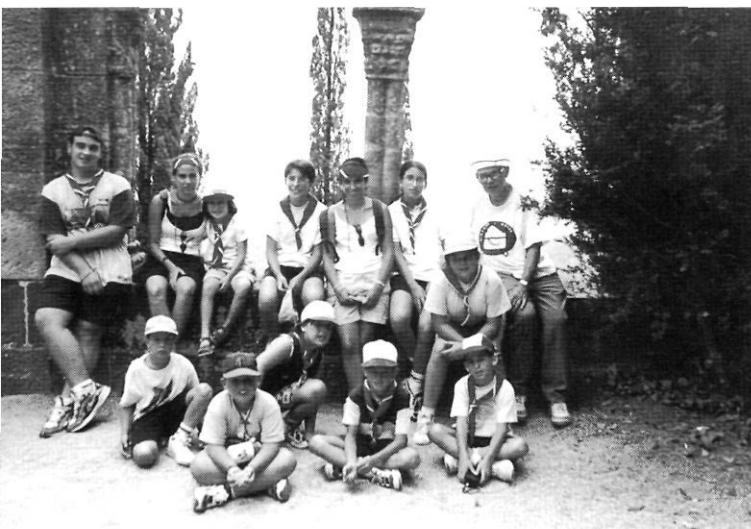
Sortida amb els escoltes de Montblanc al castell d'Escornalbou (27 de juliol del 1999).

colònies, escoltisme, excursionisme, camps de treball a l'estiu, amb el suport inestimable del Casal i del senyor Lluís Carulla Canals. Des de l'Espluga s'encarregarà de Senan, on, amb grups de joves espluguins, montblanquins i blancafortins, aconsegueix rehabilitar l'abadia, que s'enfonsava, amb tots els