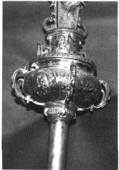
Fotografia 3.- Magolla de la creu.