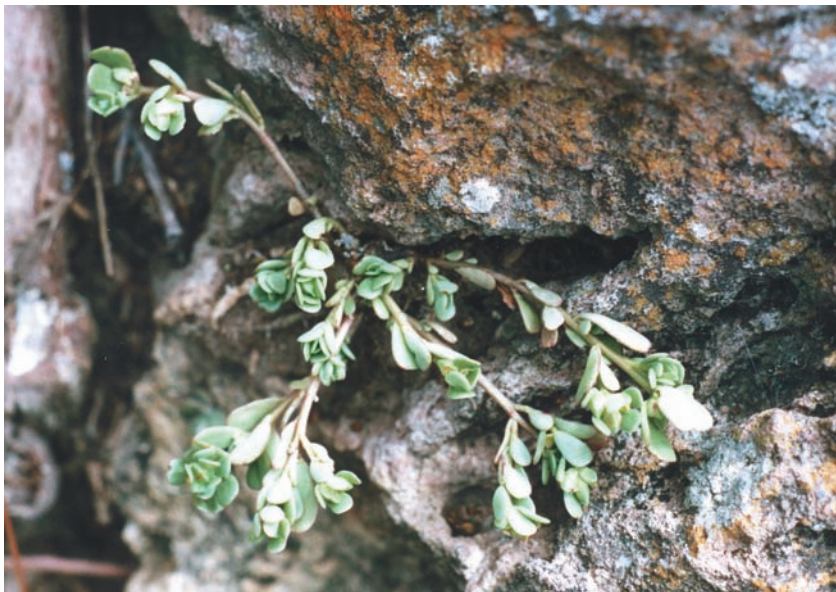
Fig. 2. Portulaca guanajuatensis en su habitat natural.