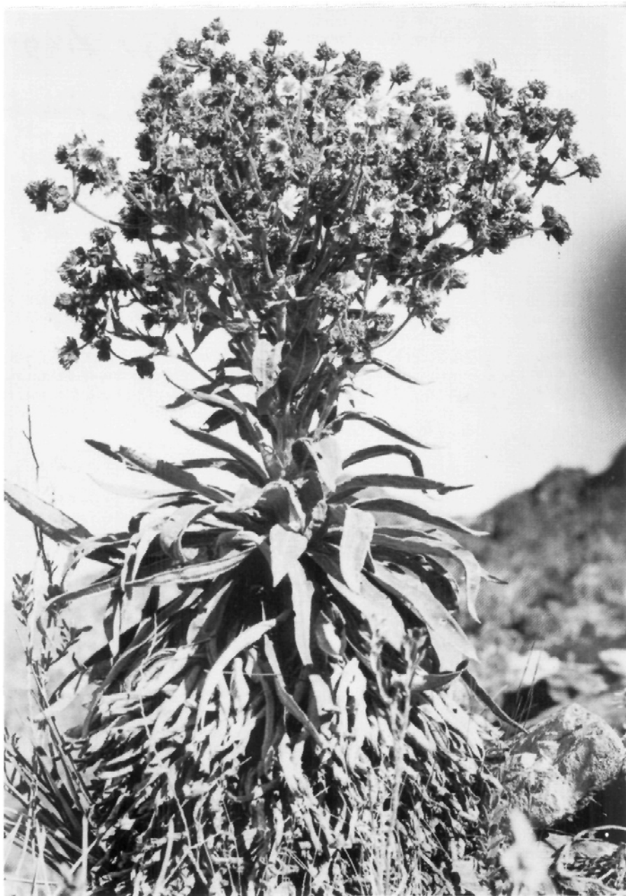
Fig. 2.— Ruilopezia lindenii (Sch. Bip. ex Weddell) Cuatr., en el páramo del Quirorá, 2800 m alt.