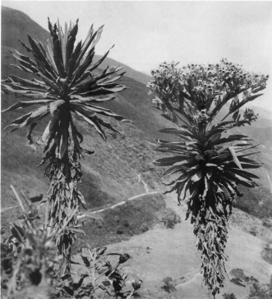
Fig. 3.— Ruilopezia marcescens (Blake) Cuatr. Páramo del Batallón, flanco oriental junto a El Portachuelo, subpáramo, 3030 m alt.