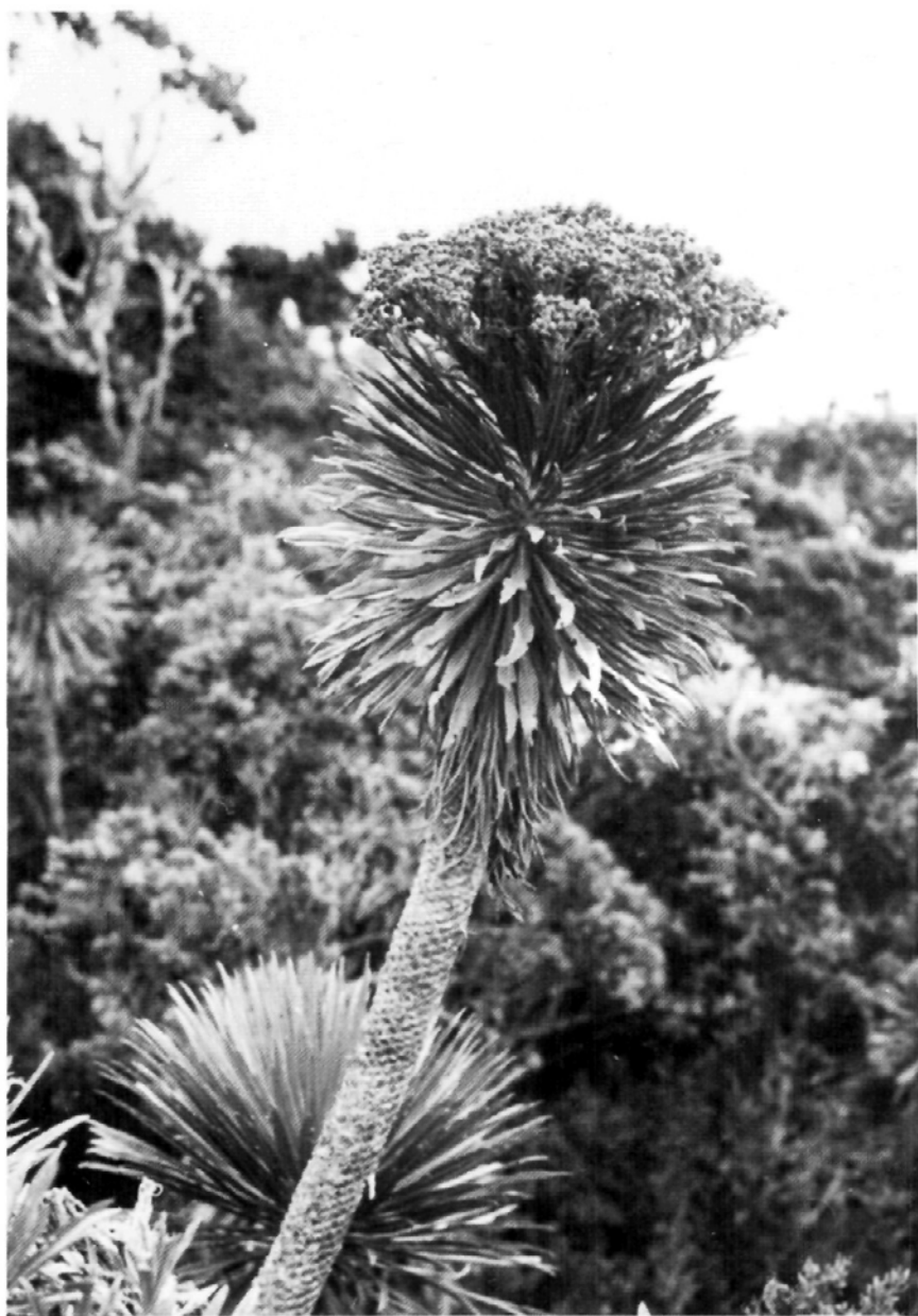
Fig. 8.— Ruilopezia paltonioides (Standley) Cuatr., en Páramo del Turmal, subpáramo en el Llano del Tigre, 3000 m alt.