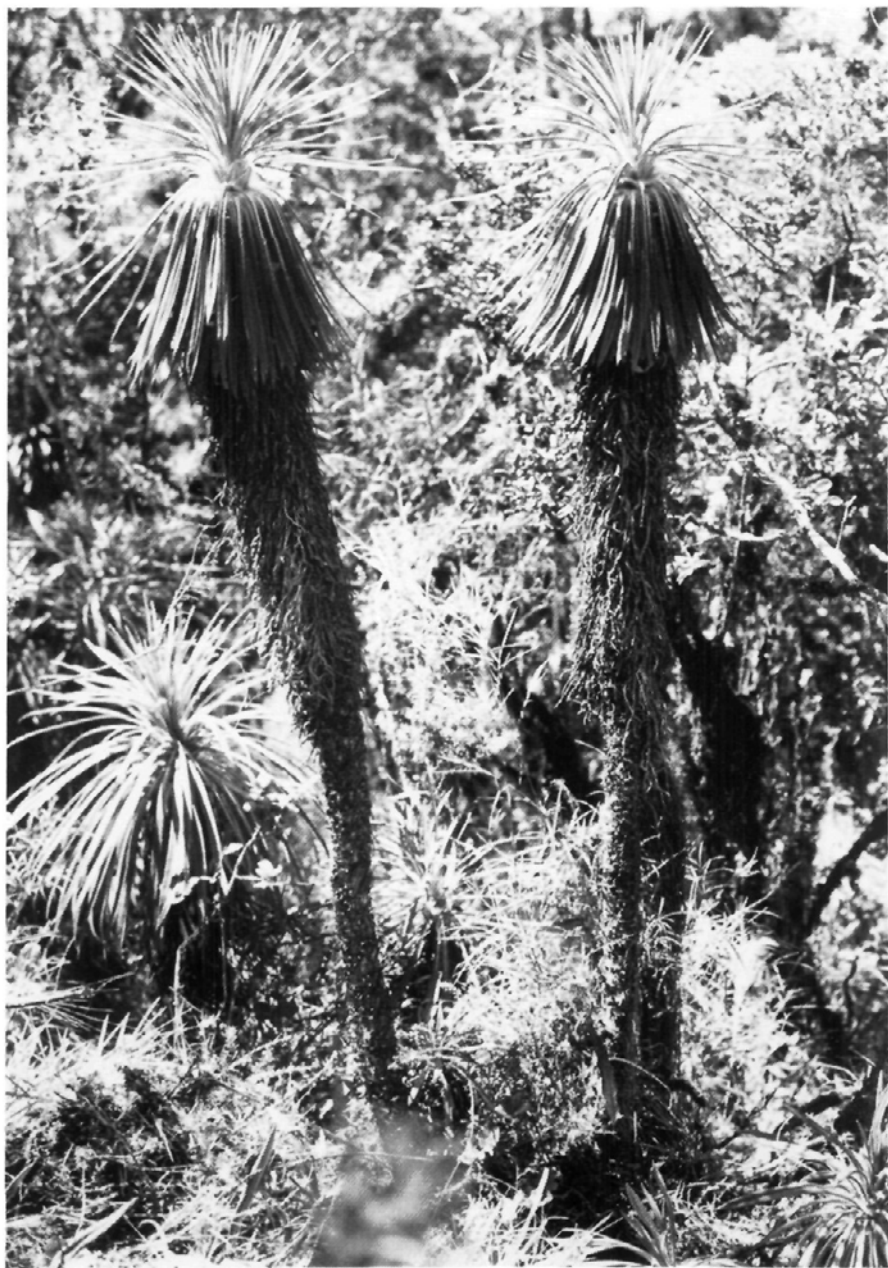
Fig. 6.— Ruilopezia figueirasii (Cuatr.) Cuatr. Individuos estériles (vegetativos), en la selva andina, 2900 m alt.