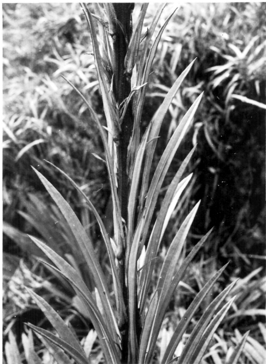
Fig. 5.— Ruilopezia viridis (Aristeguieta) Cuatr., detalle del eje inflorescencial folioso, en páramo de Guaramacal, 3100 m alt. (foto Cuatr. I-4908.)