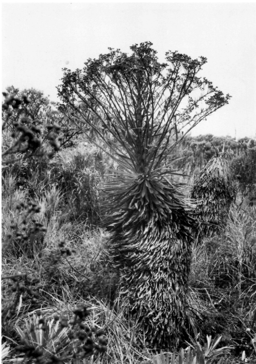
Fig. 7.— Ruilopezia lopez-palacii (Ruiz-Terán & López-Figueiras) Cuatr., en el Páramo de Guaramacal, 3100 m alt.