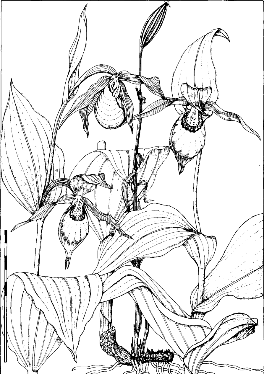
Fig. 1.— Cypripedium calceolus L.