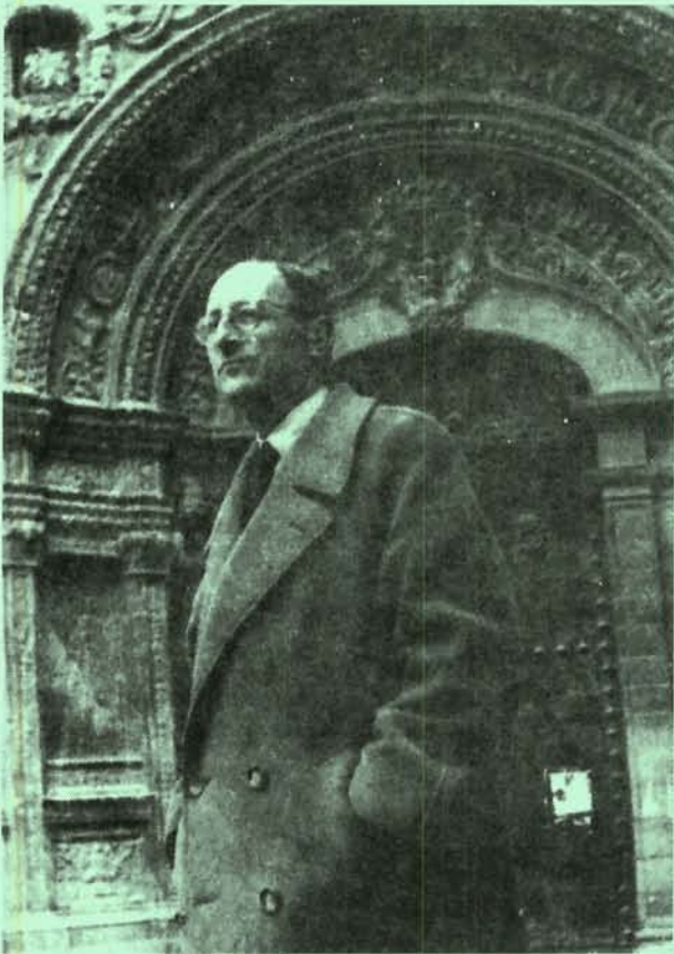
Ante la Catedral (Plaza de la Cruz). 1951.

Los poemas inéditos van agrupados con un título