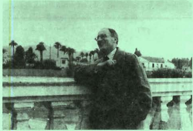
Junto al río Segura. 1951.

colectivo, «Todavía», y son: «Conciencia de suma», que vería la luz en A la altura de las circunstancias en 1963, «Orilla vespertina», aparecido en Homenaje , en 1967, donde pierde una referencia geográfica que figuraba en Monteagudo en cabeza del poema («Orleans, Massachusetts»), y «Viento de tierra», también publicado en Homenaje . Naturalmente, el título colectivo desaparece cuando se publican los poemas separados en los libros.