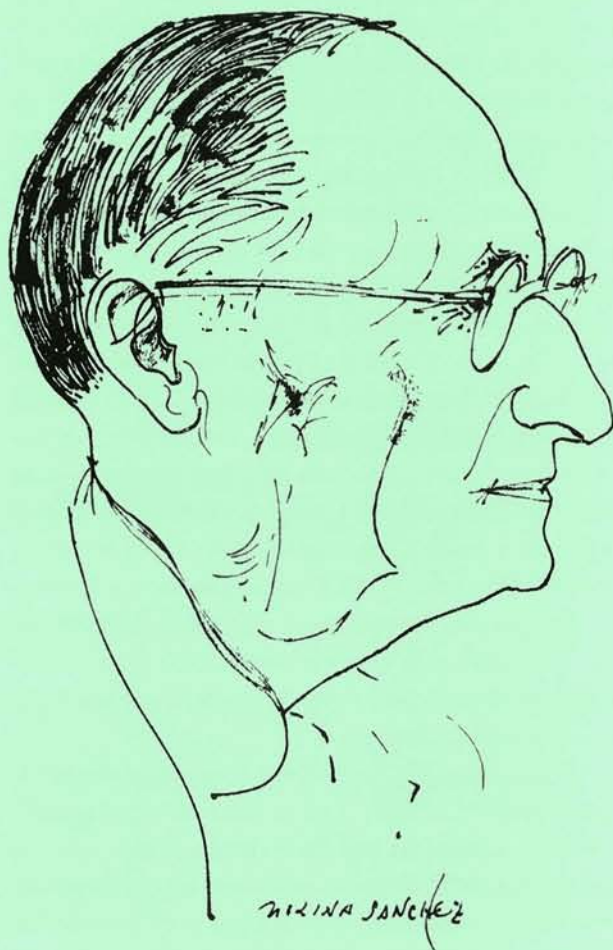
Dibujo de José A. Molina Sánchez.

Muy interesante resulta el número 31, de 1960, en el que se rinde un pequeño homenaje al poeta, con ocasión de la publicación de tres poemas inéditos, y la reimpresión de «Calle de la Aurora», que en