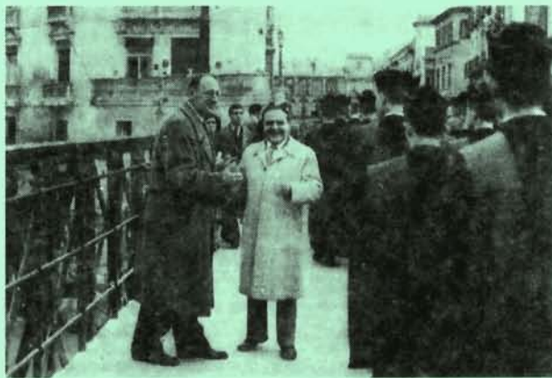
En el Puente Viejo. 1951.

Guillén, esta vez un artículo en prosa titulado «Acto de presencia», única contribución que al poeta le es posible hacer para la revista murciana debido a su avanzada edad. El texto, sin embargo, es magnífico y tiene frases, como la que lo cierra, que son de antología. O el comienzo, muy acorde con la poesía que en este momento escribe Jorge Guillén: la palabra «confusión» define con claridad el estado de ánimo del viejo lector de Miró. «La obra de Gabriel Miró ha sido ya gozada, interpretada y explicada como ella se merece. Y, sin embargo, en una época de gran liquidación de tópicos, no es atendida: no coincide con la moda. ¿Con qué moda? Todo se disuelve en una gran confusión. Entre tantos disparos y tiroteos prevalece la irresponsable futilidad». Era 1979, y el poeta, residente en Málaga, escribía cosas como la recién leída y aún más atrevidas, en el mismo sentido de sus sátiras y epigramas de la