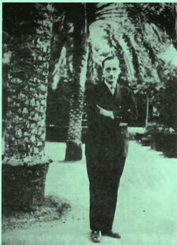
En el parque Ruiz Hidalgo. 1928

E L centenario de Jorge Guillén, que se conmemora en 1993 (el poeta nació en Valladolid el 18 de enero de 1893) es una ocasión propicia para dar a conocer aspectos sobre su figura y su obra literaria. Entre ellos, no son pocos los datos que nos faltan por conocer de la relación del poeta con Murcia y con su Universidad, de la que fue Catedrático, durante cuatro cursos, entre 1926 y 1929. Monteagudo contó con su colaboración