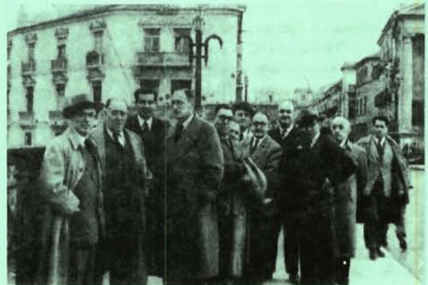
En el Puente Viejo. 1951.

Por último, hay que citar la colaboración enviada en 1981 al número dedicado a Francisco Alemán Sainz, tras la muerte del escritor. Se trata del poema «Desconcerto», una compleja reflexión desconcertada sobre las creencias del hombre y sobre la autenticidad, abierta y cerrada por inquietantes citas y muy en la línea de la poesía moral de sus últimos libros. El poeta se unía así al sentimiento de pesar por la muerte de su lejano corresponsal murciano, con este poema que sería incluido posteriormente en Final .