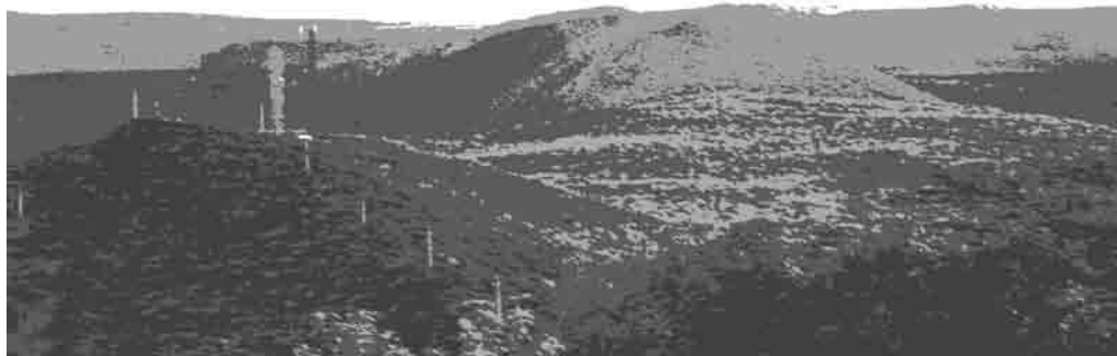
Lamina 1. Escombreras y canteras de pizarra en las inmediaciones de San Pedro de Trones (municipio de Puento de Domingo Flórez). León.

sector secundario en el que concentra mayor volumen de ocupados. Según el Impuesto de Actividades Económicas un total de 17 empresas de pizarra tenían la sede en este municipio, y cuatro empresas extraen pizarra, y dos se localizan en la parroquia de San Pedro de Trones.