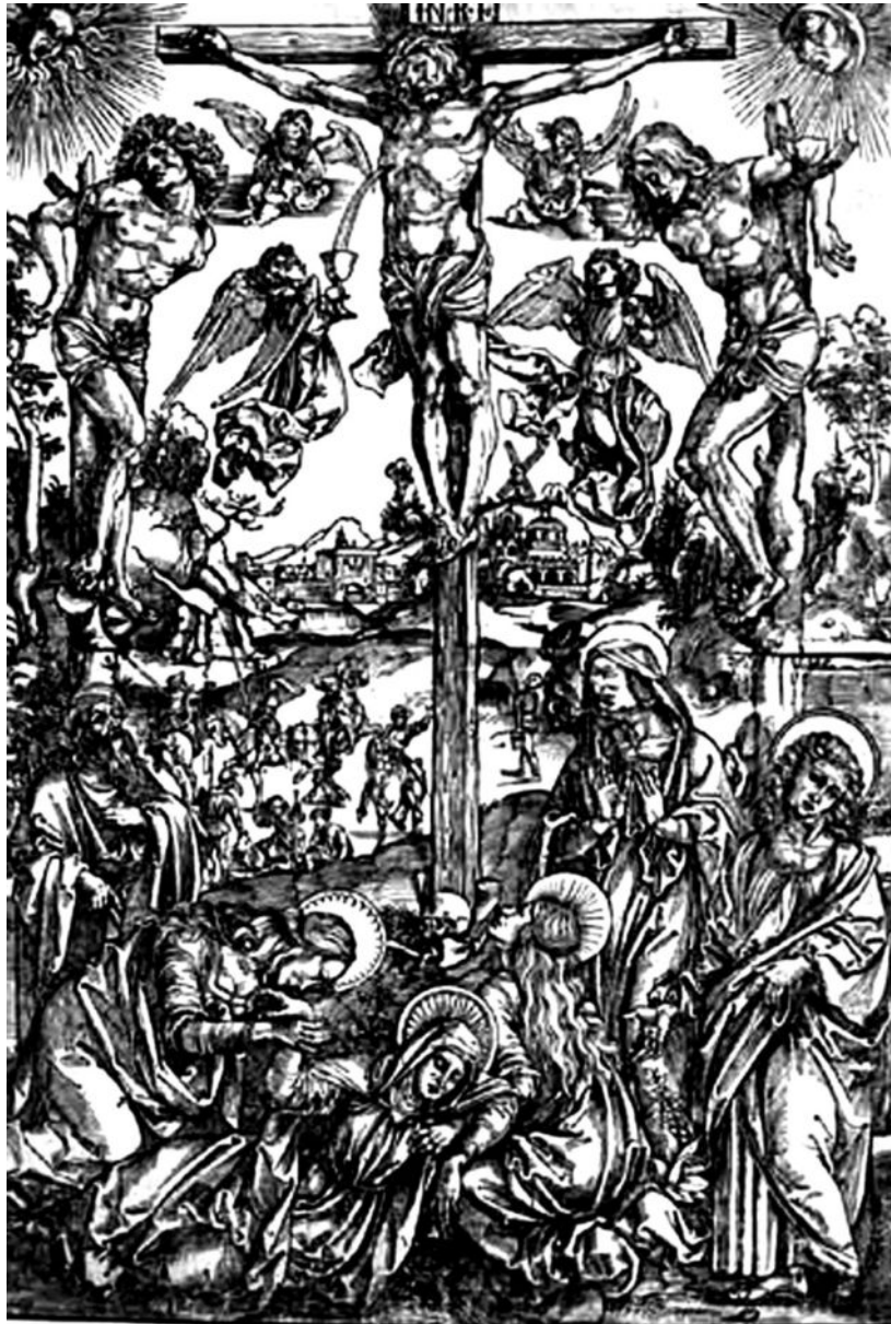
Figura 1. Crucifixión, grabado de Alberto Durero

“El sol se muestra en uno de los ángulos superiores del rectángulo, el que está a la izquierda de quien mira, representando, el astro –rey, una cabeza de hombre de la que surgen rayos de aguda luz y sinuosas llamaradas, como una rosa de los vientos indecisa sobre la dirección de los lugares hacia los que quiere apuntar, y esa cabeza tiene un rostro que llora, crispado en un dolor que no cesa, lanzando por la boca abierta un grito que no podemos oír, pues ninguna de estas cosas es real, lo que tenemos ante nosotros es papel y tinta, y nada más