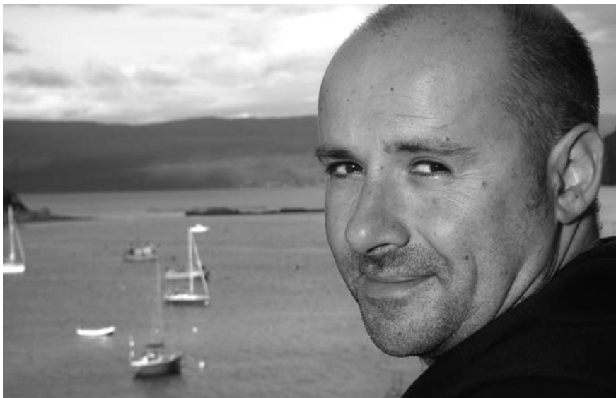
Cadaqués, espai d'inspiració i treball.

d'orgull. I més si considerem que el guardó duia el nom de Pere Calders i que el llibre seria editat per un segell editorial fort de Catalunya, Columna Edicions. Per tot plegat vaig demanar a l'artista Albert Ràfols-Casamada que em cedís un dels seus dibuixos per a la portada, a l'amic Màrius Serra que em fes el pròleg i vaig encapçalcar cadascuns dels set contes amb un fragment de les cartes que m'havia enviat Pere Calders. Alguns dels seus contes, com Deu francs de passió i A cop de falç diari van rebre molts elogis. En vols un de literal? El Màrius Serra en una ocasió em va dir : Si has estat capaç d'escriure Deu francs de passió, en tu hi veig un escriptor i jo vaig contestar-li : Si m'has fet aquest pròleg tan ocurrent, en tu hi veig un bon prologuista per a futurs llibres meus.