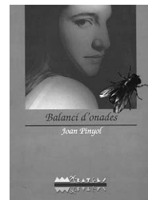
Portada del Balanci d'onades

-Igual que els primers amors, el primer llibre no s'oblida mai. Me'l va publicar Edicions del Bullent, i va ser l'inici d'una relació fructífera amb el País Valencià, literàriament parlant. Jo havia enviat els vint-i-un contes al premi de narrativa de Xàtiva però no vaig tenir la sort de guanyar-lo. Un dia, vaig comprar-me un recull de contes editats per aquesta editorial de Picanya i vaig veure que tenien un estil semblant als meus. Vaig enviar-hi els contes del Balanci i va resultar que un membre del consell editor havia fet de jurat al premi de Xàtiva i ja allí li havia agradat molt el llibre. Per aquest cop d'atzar a favor es van decidir a publicar-lo. Com que el Calders va morir quan estava a punt d'enllestir el pròleg, al final el llibre va aparèixer amb un pròleg meu dedicat a la nostra relació literària. Alguns han dit que és el llibre més caldersià que tinc, la qual cosa per a mi és un autèntic honor.