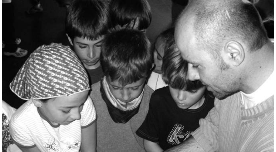
L'escriptor explicant els seus llibres infantils a l'escola.

-A partir d'aquí, i amb tota la satisfacció del món, he anat rebent premis a Eivissa, a Almassora, Vila-real i Puçol (País Valencià), a santa Bàrbara (El Montsià), a Olot (La Garrotxa), a Granollers (Vallès Oriental), a Caldes de Malavella (La Selva), a Mèxic DF, al Pla del Penedès (Alt Penedès) i el darrer a Blanes (també a la comarca de La Selva).