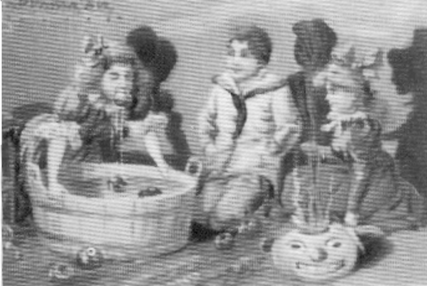
Pie de Ilustración de Halloween (Barreño de zinc) 17