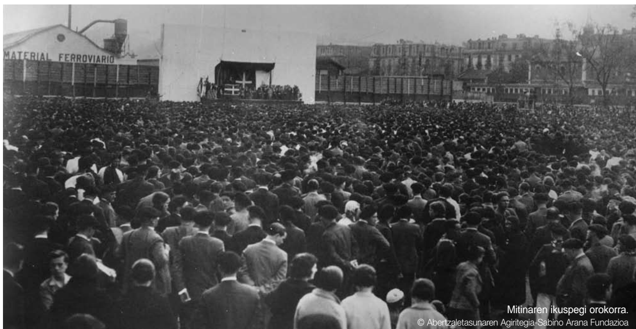
Mitinareen ikuspegi orokorra.