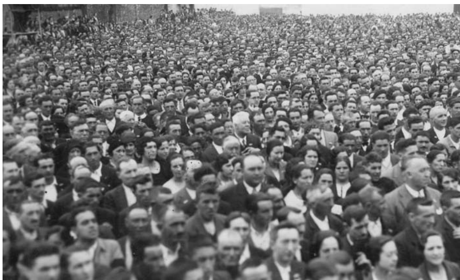
Mitinaren ikuspegi orokorra.