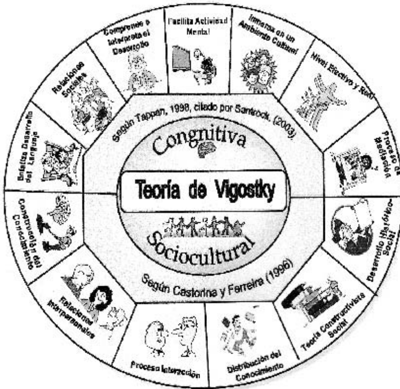
Gráfico 1. Mandala de la teoría cognitiva sociocultural de Vygotsky. La ilustración se adaptó a las preposiciones expuestas en el libro la Psicología de la Educación . Santrock, J. (2000), pp. 40-47.

En el gráfico 1 se ilustra las ideas esenciales de la teoría sociocultural de Vygotsky. El autor postula que al establecer relaciones interpersonales con los agentes mediadores, el ser humano desarrolla los procesos psicológicos superiores, lo cual implica que a través de la educación se promueve el desarrollo individual de los miembros del grupo y la asimilación y producción de la cultura del grupo.