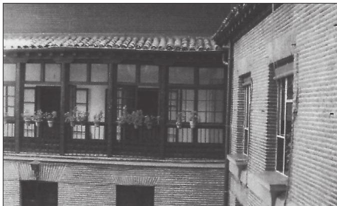
Galería original del patio del convento.

tos y reliquias. Mas otra pieza para despacho de la señora Comendadora. Una sala de capitulo con su altar chapado de azulejos y asientos de tablo- nes al rededor. Una pieza grande con quatro bentanas al jardin que coje todo un lado del claustro a la parte de la Yglesia y se pasa a la escalera se- creta de las zeldas. Un transito que va a las ofiçinas comunes que tienen diez divisiones con puerta cada una. Para subir a los desbanes ay quatro escaleras secretas con sus puertas y zerrajes, estan fabricados los desba- nes, las armaduras de par y hilera ajalbalconados y echos zielos rasos las dichas armaduras y jabalcones tabicados al rededor del suelo una bara de alto contra las armaduras y en todos los dichos desbanes ay veinte y zin- co piezas grandes y pequeñas con sus guardas para las luçes, puertas he- rrajes y zelosías y los suelos de ladrillo fino por raspar menos, el desban que sirve para las gallinas de las enfermas esta solado de yeso. Esta sola- do todo el quarto principal alto de ladrillo fino cortado y raspado y los passos con sus puertas y ventanas y errajes. Ay en toda la vivienda dos alaçenas mas de las referidas con puertas y tres repisas grandes y sirven de altares, una en el noviciado, otra en la enfermeria y otra en una her- mita altar que esta en los desbanes retirada. Ay tambien rejas embebidas en los zercos y ralloos en catorçe ventanas que ay en la parte de la calle dentro de la clausura.