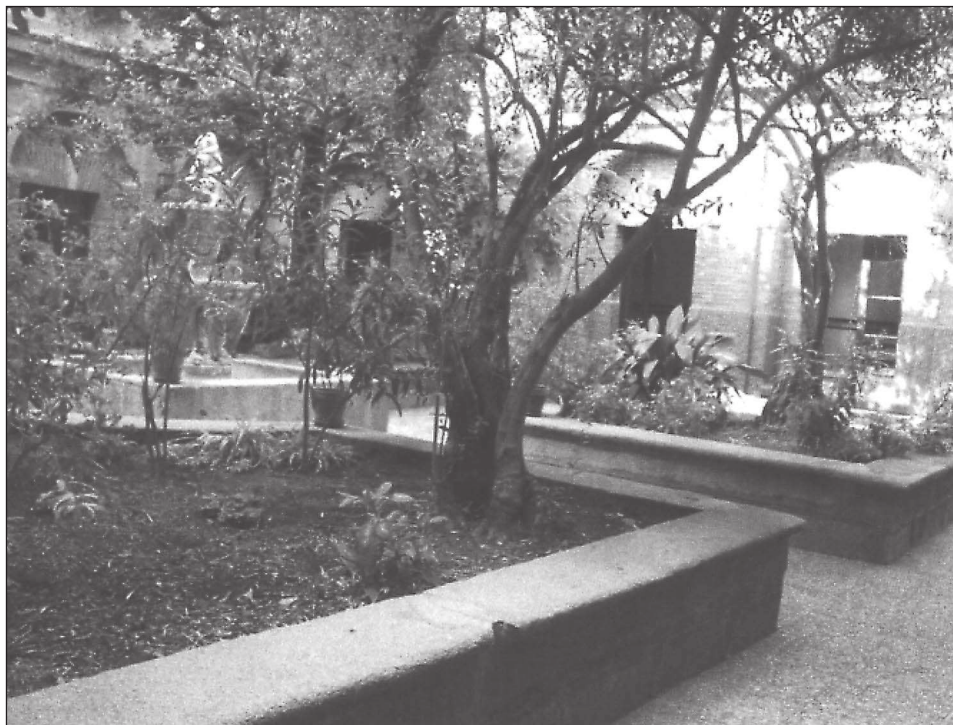
Interior del patio del convento.

zorcados de yerro con falleba, zerradura, pasador, picaporte y barra para resguardo los cuales reparos se han echo de orden de dicha Señora Comendadora... Mas están rebocados los quatro patios de albañileria y el claustro por la parte del jardin y el lienço de pared que coje desde la Yglesia asta la esquina de la calle de don Juan de Alarcon y cae a la calle del barco y desde la dicha esquina asta el fin de la cassa que mira a la calle de don Juan de alarcón esta rebocado de pilares de ladrillo y tapias y todos los zimientos de la calle y patios y todas las rejas cubiertas de varniz negro» 8 .