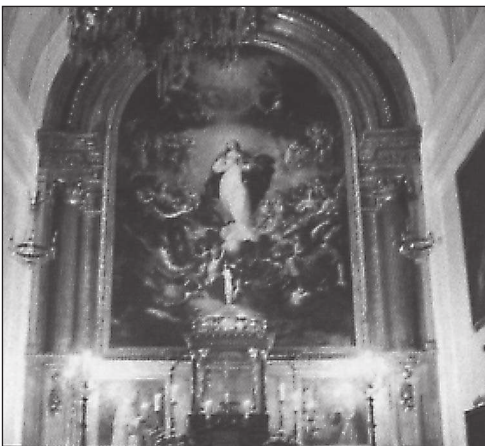
Iglesia de las Mercedarias de don Juan de Alarcón.