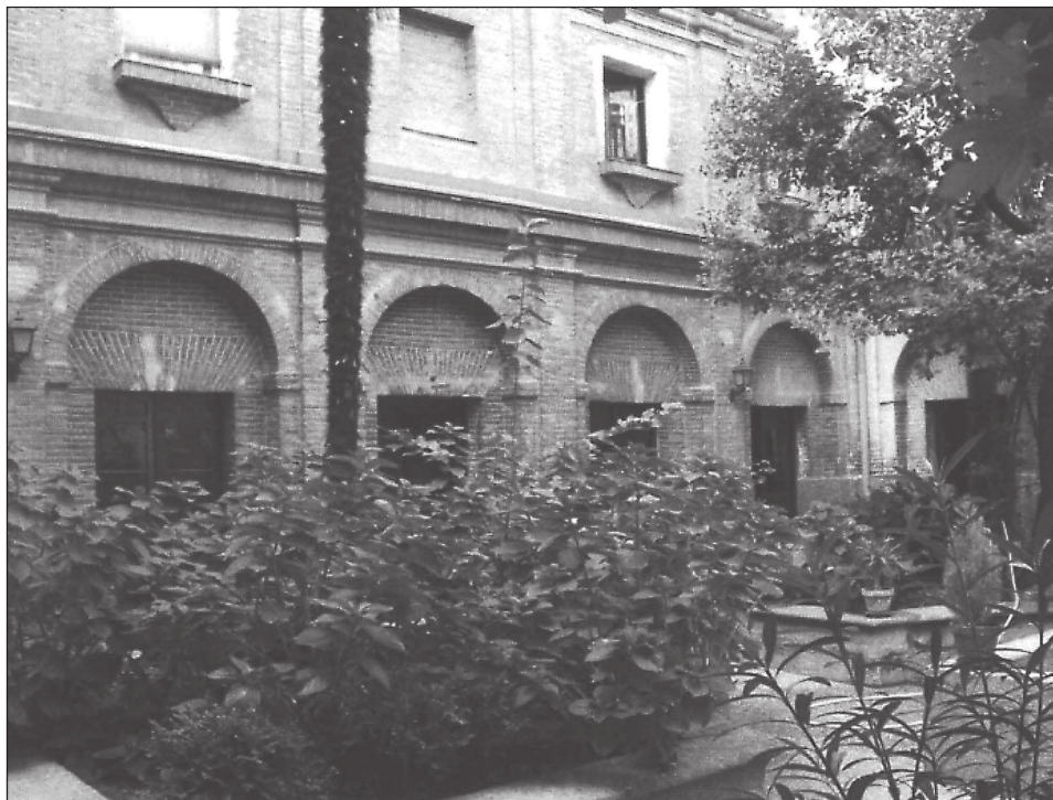
Interior del patio del convento.

blanquearon poniendo puerta y bentana nuevas; y asi mesmo se blanqueo un paso en que estan los confessorarios y se solo de valdosa y se blanqueo la escalera principal antigua en que se repararon de yeso negro antes muchas quiebras en ella y en el ante coro, pieça de la campana y el coro grande, en que avia quiebras considerables y se blanqueo el coro pequeño que cae a el colateral de San Joseph y en todas estas pieças se solo todo lo que estaba maltratado de ladrillo fino: assi mesmo se deshiço y levanto la armadura del tejado que esta sobre el aposento del cordel de la campana, sobre el antecoro; passillo escalera principal y coro Pequeño que es la tirantez desde el resalto del colateral asta el frontispico de la calle y resolvió a hazer y poner en todo la tabla y madera que faltaba y teja rematandolo todo por que amenaçaba ruina y se trastejaron donde vive el sacristan y en el que esta el campanario y el del caracol. También se blanqueo la capilla del Santo Christo que esta detras del Altar Mayor y el paso asta la escalera y se solo de valdosa cortada y raspada fina. Mas se rompio una puerta en la sacristia que sale a la calle y se sentaron unas puertas nuevas labradas a dos azes con dos quarterones en que ay baraustes ama-