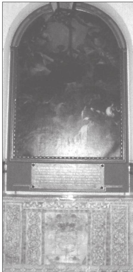
Hornacina en el claustro.

cho con su requadro; frontispicio y encima del nicho remates y en el medio una peana para una ymagen de Nuestra Señora y esta dicha ysería está fingida de marmoles. Mas adelante ay una pieça que sirve de roperia con sus anaqueles labrados. Un labadero con dos pilas con sus llaves de agua y mas adentro una cozina con su hogar chapado de piedra berroqueña, campana y cañón para hacer coladas. Una pieça grande que llaman de profundis con sus asientos al rededor. Un refectorio con sus mesas de nogal con columnas de lo mesmo con sus asientos al rededor. Una oficina que sirve de despensilla con sus anaqueles en dos ordenes. Otro patio de luçes donde esta el posito en quatro tinajas con su arca de llaves para las cañerías y las tinajas tienen tapas de piedra berroqueña. Otra oficina para remojar pescados. Un estanque grande con su pretil al rededor para las oficinas comunes solado todo con piedra berroqueña con un po-