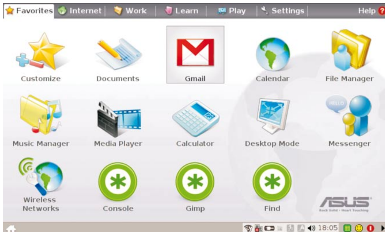
Escritorio de Asus Eee Pc

to, vuelva a adelantarse a todos con su nueva generación de ultraportables, el XO2, textualmente: un libro electrónico 11 .