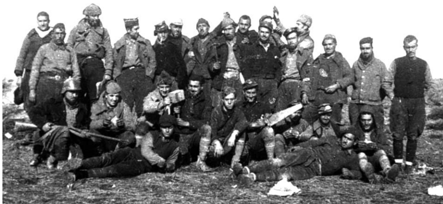
Soldats de la centúria Serafí Espinós organitzada per la JSUC a Sabadell. Front d'Aragó, 1936.

Hi ha qui diu que als anys finals no n'hi havia per tant. Les detencions, les tortures i els empresonaments duren el que dura la dictadura i encara l'any 1966 fins a 1976 hom calcula a la baixa que el nombre de detinguts per motius polítics a Sabadell fou de 259.