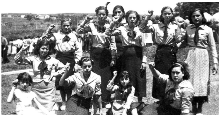
Noies de la JSU de Sabadell (Pins del Vallès, 1 de maig de 1936).

Un dels elements més imperceptibles de la desmemòria afecta la pròpia identitat sabadellenca. On és el Sabadell de la justícia, de la solidaritat, de la fraternitat, de l'autonomia moral, de la cooperació, del federalisme, de l'ètica civil republicana? On és el Sabadell de Francesc Viladot, Tomàs Viladot, Teresa Claramunt, Josep Miquel, de