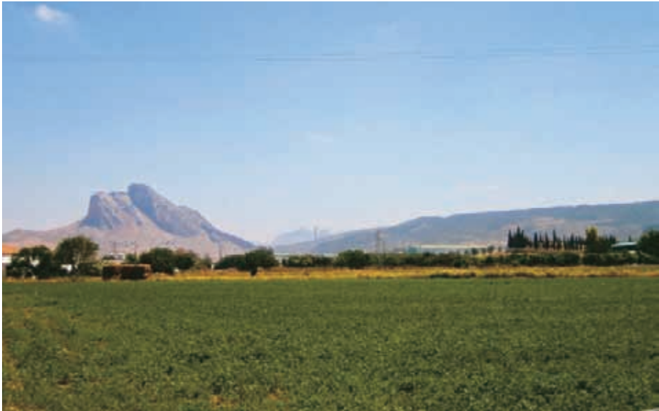
Foto 5. Una imagen de la Vega de Antequera: a la derecha, la colina y túmulo de El Romeral; al fondo, la Peña de los Enamorados

la masividad de, por un lado, la Peña de los Enamorados, el Arco Calizo y la propia Transversal y, por otro, lo que podemos denominar el «trazo fino» de la Vega y la ciudad, caracterizadas ambas por las texturas y formas que derivan de sus respectivas formas de poblamiento, el hábitat disperso y el concentrado.