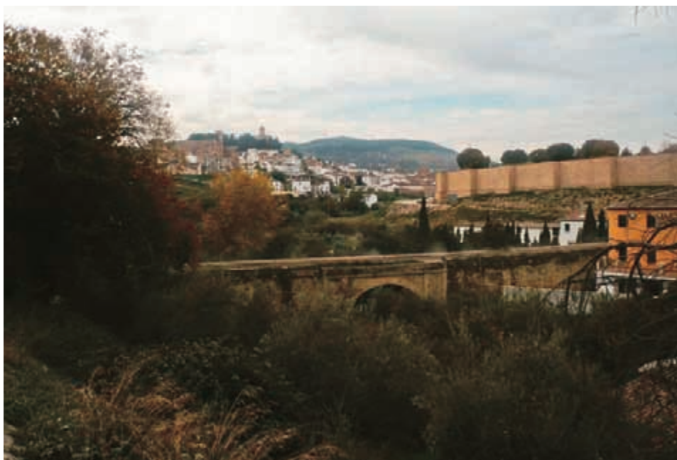
Foto 6. La colegiata de Santa María la Mayor de Antequera desde el Río de la Villa