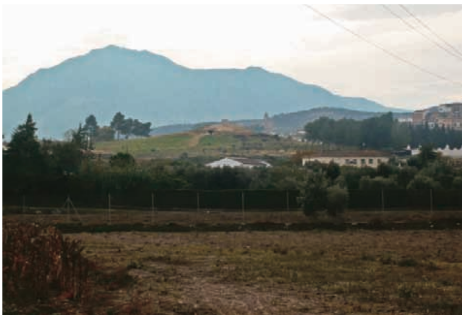
Foto 7. La colina y túmulo de Menga, desde la Vega de Antequera

de lugares conspicuos en los límites entre cuencas visuales: una acrópolis (el conjunto que forman la Alcazaba y la Colegiata); la ermita de la Veracruz, visible desde algunas partes de la ciudad pero más aún desde la Vega; en cuanto a las colinas de Menga y Marimacho, constituyen un conjunto que separa las dos cuencas que atraviesa el Río de la Villa. Este es el lugar de emplazamiento del dolmen de Menga, que constituyó un lugar de gran relevancia simbólica en algunos períodos de la Prehistoria Reciente 16 .