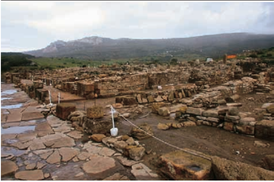
Foto 2. La Loma de San Bartolomé desde el aparcamiento de Baelo Claudia