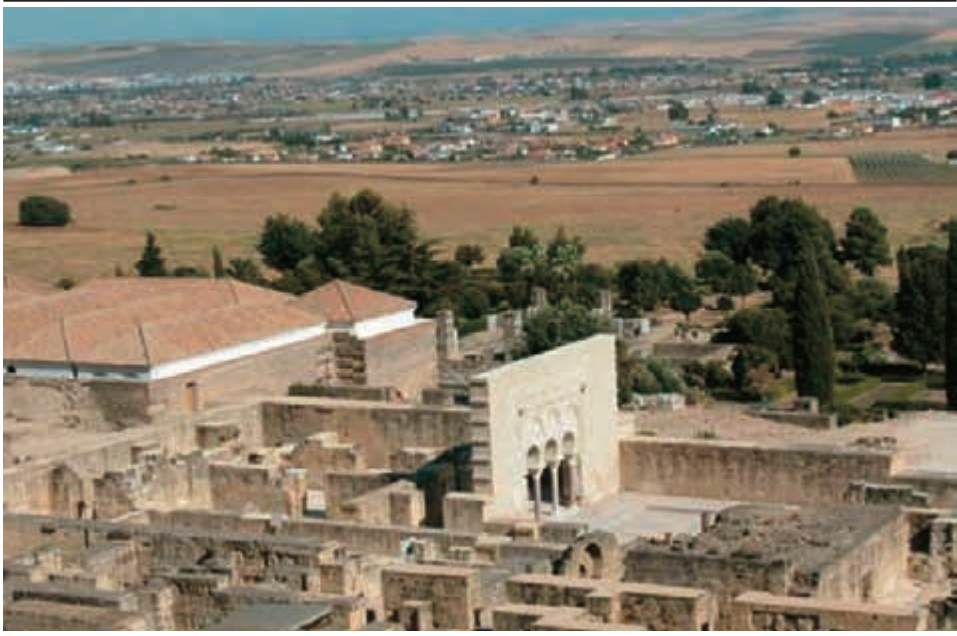
Foto 4. Madinat al-Zahra desde La Vega del Guadalquivir