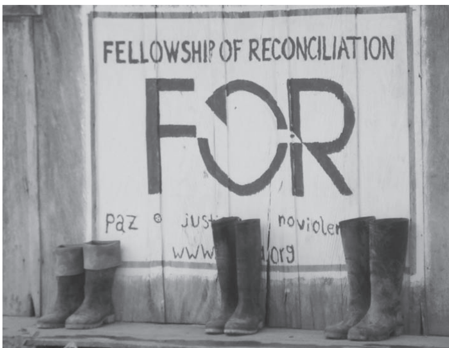
Foto 2. Sede Congregación para la Reconciliación. Vereda La Unión, Corregimiento San José de Apartadó.

en día. Otros son recordados por su largo calzado, sus dietas vegetarianas y vegan , su pelo largo y –muy a menudo, de la misma manera como he sido también objeto de burla por parte de los mismos campesinos de la Comunidad de Paz de San José de Apartadó– por su torpeza al caminar por los tupidos y siempre inundados caminos de la Serranía (ver la foto 2).