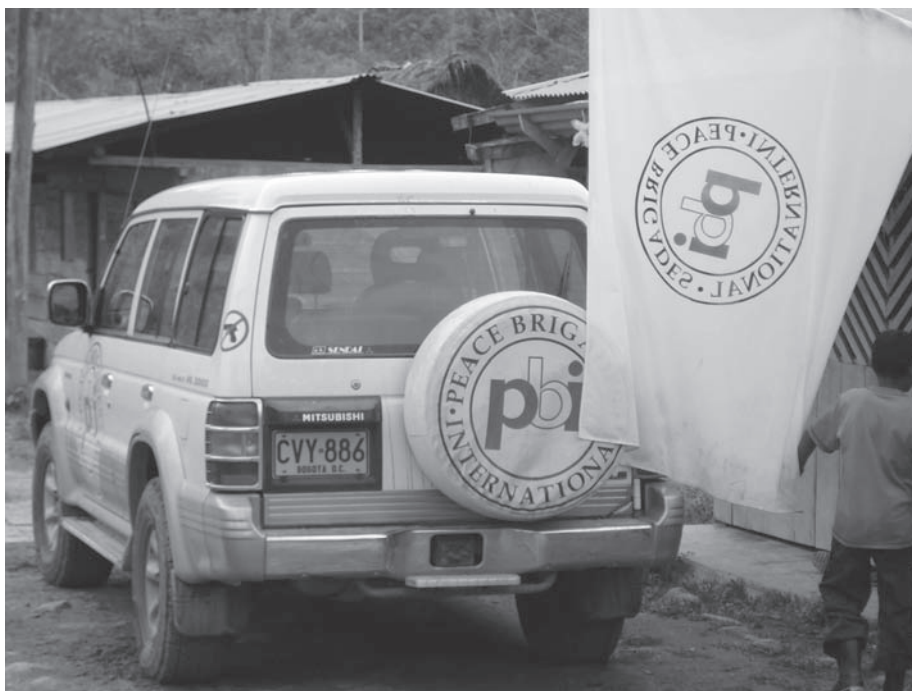
Foto 3. Casa Internacional, San José(cito) de Apartadó.