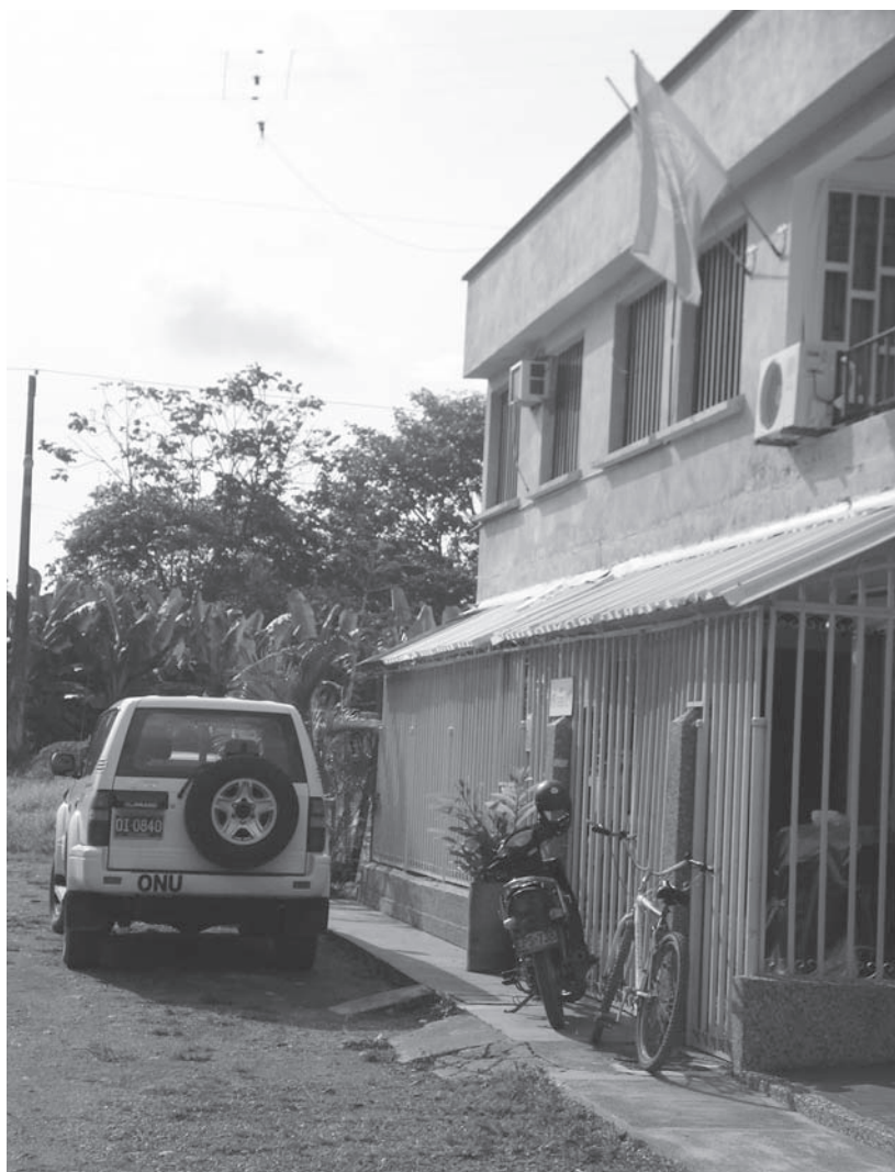
Foto 1. Barrio Ortiz, Sede ACNUR.

Ortiz, en las cuales cuadras enteras están conformadas por los edificios de estas organizaciones. Desde la distancia, las banderas blancas, las antenas satelitales y las camisetas blancas se convierten en la mejor referencia visual para guiarse hacia estas oficinas. De países como Estados Unidos, Canadá, Suiza, Alemania, Holanda, Italia y Portugal, casi la mayoría de estos ‘internacionales’ apareció en la ciudad alrededor de 1996-1997, en el contexto de las violentas campañas contrasubversivas que desplazaron masivamente comunidades a lo largo del Urabá antioqueño y chocono. Aunque algunos de estos voluntarios ya no viven más en el área, pues sus períodos de voluntariado acabaron, sus crónicas, historias y resistencia física frente a las largas jornadas son evocadas en conversaciones hoy