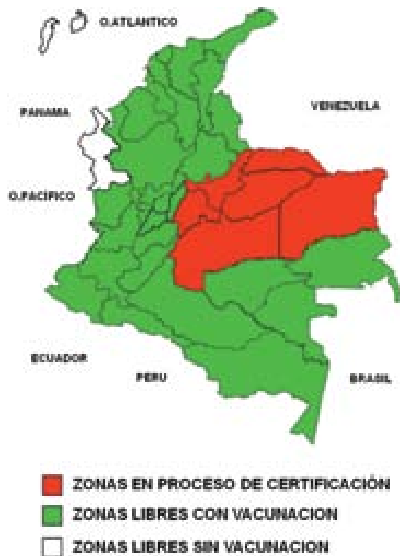
Figura 1. Situación actual de Colombia con respecto al VFA. Se presentan las zonas con la certificación otorgada por la Organización Mundial de Sanidad Animal, OIE, como libres de fiebre aftosa (libre sin vacunación y libre con vacunación) (58).

países que conforman la Comunidad Económica Europea. Sin embargo, se debe tener en cuenta que el VFA recientemente re-emergió en varios de los países de Europa y América, antes declarados libres; para mayo de 2001, Argentina, Francia, Irlanda, los Países Bajos, el Reino Unido (RU) y Uruguay, perdieron el estatus de países libres otorgado por la Organización Mundial de Sanidad Animal (OIE).