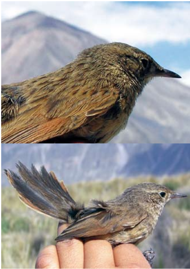
Figura 2. Asthenes sclateri , especie caracterizada por las estriaciones dorsales (foto superior), y bordes externos de las rectrices de color rojizo (foto inferior). Nótese el hábitat (pajonal de puna seca) en el fondo.