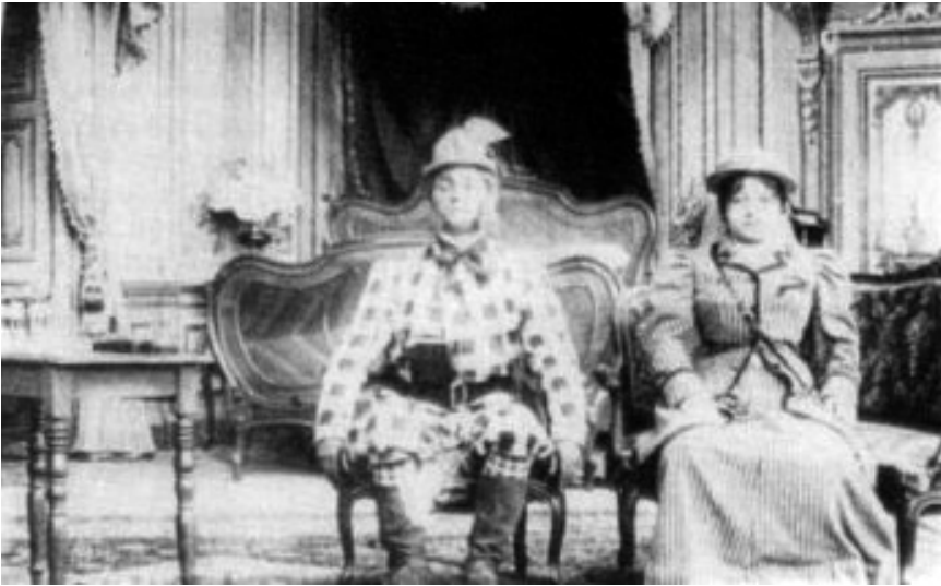
Fotograma d'un dels curtmetratges

Voyage au planete Júpiter (1909), el somni d'un rei que viatjarà pel firmament de la manera més impensable; Una excursión incoherente (1909), una excursió convertida en un malson, i Superstition andalusa (1912), un somni convertit en una petita pel·lícula d'amor i aventures.