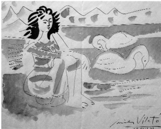
Dona amb cignes. Javier Vilató, 1955

On són les dones? Espais femenins a l'art català dels segles XIX i XX és el títol de l'exposició que es podrà veure al Museu d'Art de Sabadell fins el 4 de febrer. Aquesta és la segona mostra col·lectiva de la Xarxa de Museus Locals de la Diputació de Barcelona. Aquesta xarxa el que pretén és potenciar el rendiment dels seus fons museístics i, a la vegada, fer una revisió de les col·leccions dels segles XIX i XX del vint museus locals.