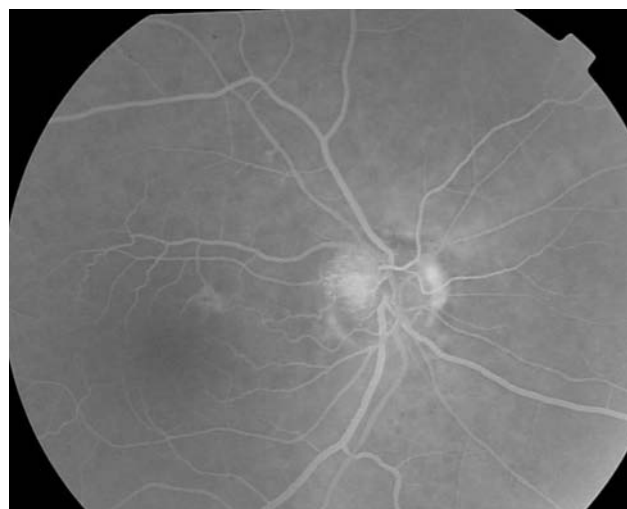
Fig. 2 Hiperfluorescencia de la mitad superior de la papila óptica derecha durante la angiografía fluoresceínica.

gre del fármaco. Sin embargo, el papel de estos agentes en la aparición de NOIANA es controvertido y parece no ser dosis dependiente 1 . La NOIANA no está relacionada con la inflamación de las arterias.