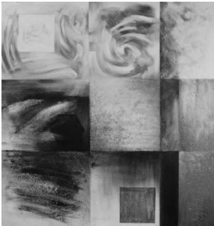
Jardín 6, 1994