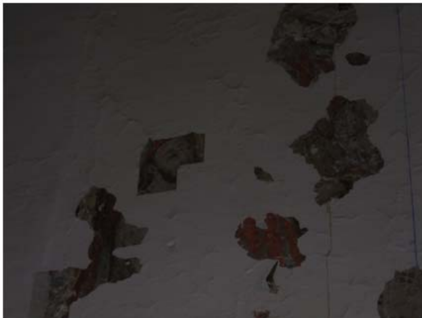
Imagen 9: Pinturas descubiertas en la sala De Profundis.