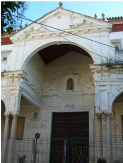
Imagen 12: Portada de la iglesia, a la que no se accede.