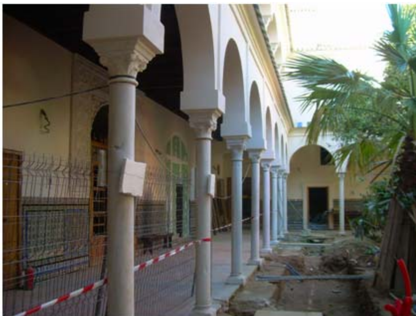
Imagen 5: Obras en el claustro.