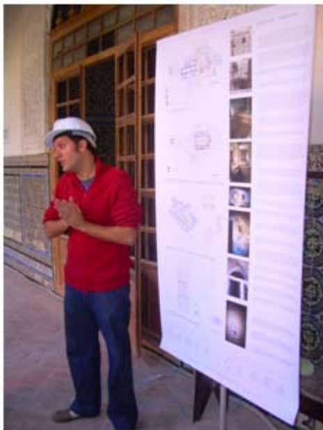
Imagen 4: Explicaciones previas al itinerario.