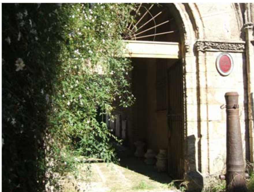
Imagen 13: Antigua portada de la Universidad, recolocada en el compás del monasterio.