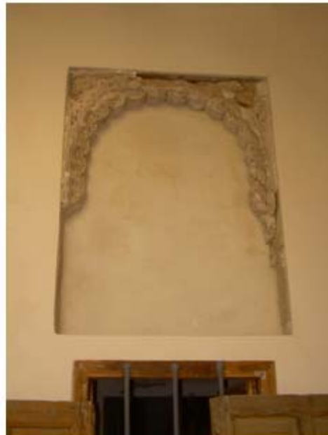
Imágenes 2 y 3: Entrada al Cenobio. Ventana con yesería del palacio islámico.