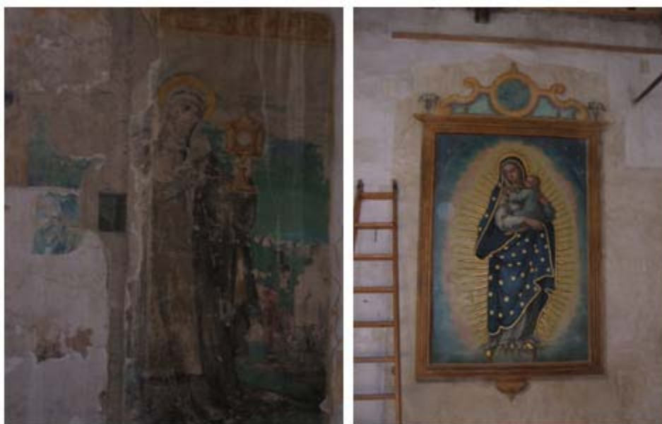
Imágenes 7 y 8: Muestra de pinturas murales aún por restaurar. Cuadro de la Virgen de Guadalupe.