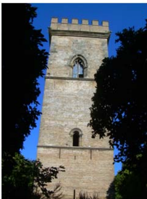
Imágenes 10 y 11: Imagen de San Cristóbal. Torre de Don Fadrique.