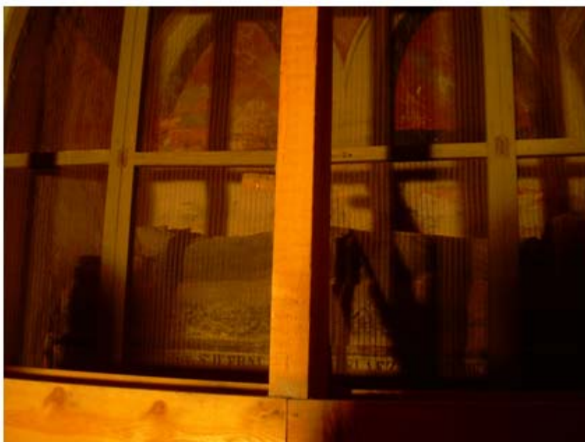
Imagen 6: Sepulcro del Obispo de Silves.