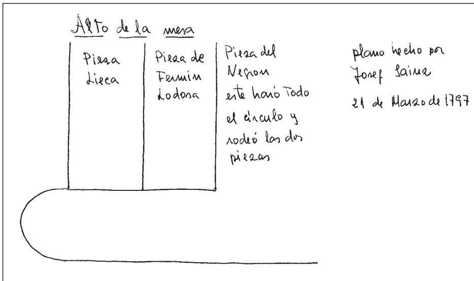
Plano hecho por Josef Sainz el 21 de marzo de 1797

En las ordenanzas municipales del año 1892, Sección 14, artículo 241, se prohíbe toda clase de roturaciones o intrusiones en los sotos, montes, prados boyerales, caminos, pasadas, cañadas y demás vías pecuarias.