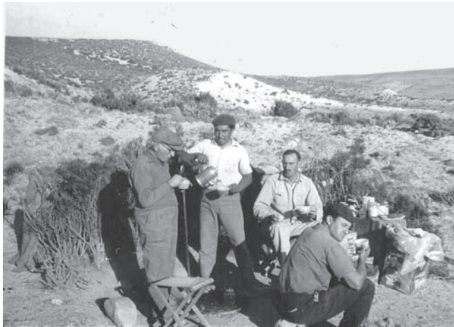
Rodolfo Casamiquela (sentado, en el extremo derecho) en una expedición científica en la Patagonia a mediados de la década de 1950 (foto cortesía Eduardo Tonni).

En 1965 la Universidad Nacional del Sur había publicado su Rectificaciones y ratificaciones. Hacia una interpretación definitiva del panorama de la Patagonia y área septentrional adyacente donde Casamiquela pretendía “aclarar el confuso panorama etnológico de la Patagonia”, producto de la imagen forjada por los viajeros, exploradores y cronistas que la recorrieron; de las erróneas interpretaciones que de esos escritos se hicieron y de los aportes de otros idóneos etnógrafos contemporáneos. Se apoya para ello en sus conocimientos lingüísticos para redefinir a las distintas parcialidades, sus límites y dispersión. Revisa las identidades adjudicadas a ciertos grupos y los significados de sus denominaciones tradicionales para establecer, finalmente, un panorama etnológico que será, posteriormente, tomado por los antropólogos para aceptarlo o rebatirlo pero nunca ignorarlo.