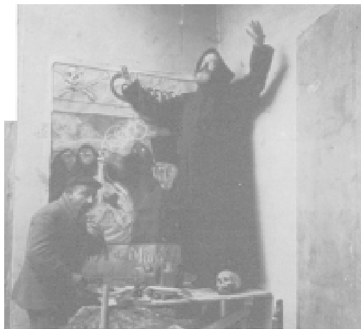
Fig. 7. Escena satírica. 1909.

Una temática fotográfica que circuló a menudo por canales soterrados fue la erótica, que a menudo andaba por el filo de la navaja de lo artístico para enmascarar la finalidad psicalíptica. El desnudo, que contaba con una arraigada tradición en la pintura, fue un tema controvertido en fotografía debido al gran realismo que ésta ofrecía, pues parecía hartamente complicado sublimar un cuerpo desnudo sin que mediaran los pinceles, y esto se aprecia en que «los primeros desnudos fotográficos fueron posadas por prostitutas» 20 . La estrecha amistad de Arturo Cerdá con pintores como López Mezquita, Rodríguez Acosta e incluso Sorolla influyó mucho en esta modalidad fotográfica, pues habitualmente las modelos posaban adoptando poses pretendidamente pictóricas (Fig. 8) bien en el estudio de un pintor, en escenarios campestres 21 o incluso en las calles de Tánger (Fig. 9). A veces es difícil trazar con nitidez la frontera entre las fotografías de desnudos femeninos de raíz pictorialista de aquéllas que estaban pensadas para abastecer el mercado de fotos eróticas, aunque las instantáneas de Cerdá y Rico tienen siempre un regusto artístico ligado a la iconografía pictórica de finales del siglo XIX y primeros años del siglo XX que las alejan de las burdas fotografías hechas por manos anónimas destinadas al mercadeo 22 . Operadores que realizaron in-