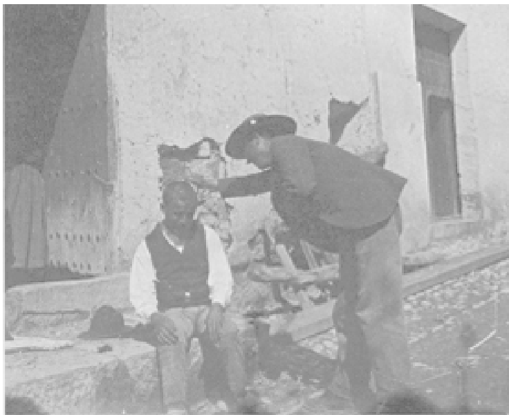
Fig. 15. Barbero. 1903.

A diferencia de los operadores norteamericanos, la fotografía documentalista no es pensada como un elemento de denuncia social, como un aldabonazo gráfico para criticar ante las autoridades e instituciones públicas las penosas condiciones de vida de determinados sectores sociales. Esto fue practicado por la llamada fotografía documental , cuya génesis radica en las fotos que Lewis Wickes Hine -que estudió sociología en varias universidades estadounidenses- realizaba en la primera década del siglo xx a los inmigrantes que arribaban a Nueva York, pues este operador estaba muy concienciado por el bienestar de los segmentos más desfavorecidos 45 . La fotografía documental consideraba que la cámara era un poderoso medio para la reivindicación social. Las instantáneas de Cerdá siguen apegadas a las fórmulas narrativas visuales que resaltan el tipismo y los estereotipos sociales, cuyo común denominador es que son visiones burguesas de la sociedad española y que no tienen como finalidad la realización de crítica alguna o de poner en tela de juicio las raíces de un sistema político -la monarquía liberal de Alfonso XIII-, sino únicamente la constatación fotográfica de gentes que llevan unos estilos de vida tradicionales.