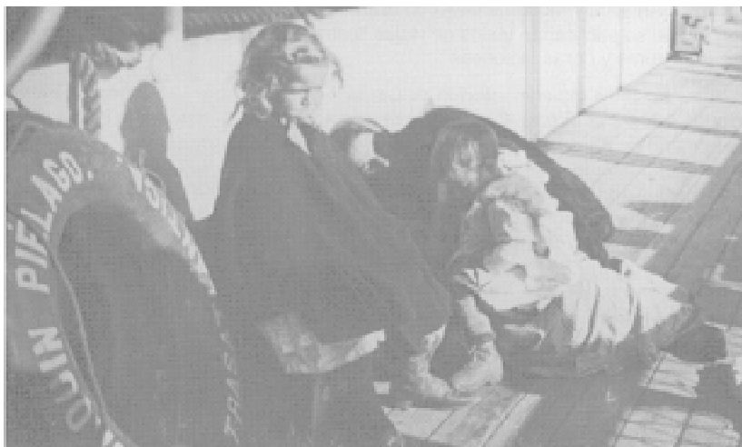
Fig. 13. Emigrantes. 1907.

sión a cualquier alteración de la naturalidad, retocado o manipulado de los negativos o copias, pues se reputaba a la fotografía como un medio artístico legítimo en sí mismo, que no requería de maquillajes ni afeites para ser una modalidad artística más. Alfred Stieglitz, en 1907, toma una célebre fotografía titulada The Steerage (La cubierta del barco) 36 -el autor la considerará la mejor de toda su obra- en la que un grupo abigarrado de personas deambula por la cubierta del transatlántico de lujo Kaiser Wilhelm II 37 . Esta fotografía debió conocerla -y admirarla- Arturo Cerdá, pues toma varias muy similares con motivo del viaje que efectuó a Tánger en 1907 38 , Y en varias ocasiones acudió a esta modalidad de fotografía directa (Fig. 13), sobre todo cuando quería registrar aspectos relacionados con la modernidad 39 .