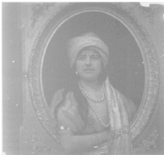
Fig. 10. Retrato orientalista. 1910.

estas placas ofrecen un aspecto granulado. El proceso para obtener placas autocromas resultaba complicado y caro, por lo que sólo estaba al alcance de un reducido grupo de fotógrafos cuyo nivel adquisitivo podía permitirle obtener fotos en color. Las naturalezas muertas a base de jarrones con flores variadas serán las predilectas de Cerdá, aunque también incorpora a los bodegones piezas de cerámica o de cristal muy en la línea de la pintura barroca -denominada en el siglo XVII pintura del silencio -, pero no sólo se limita a repetir manidas composiciones, sino que inserta en los bodegones elementos ornamentales y botellas que reactualizan el lenguaje de los bodegones. En este sentido, la figura referencial para Cerdá y Rico fue Santiago Ramón y Cajal,