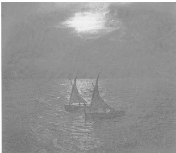
Fig. 11. Valencia. 1904.

obsesivamente escenas acuáticas 27 (Fig. 11), en las cuales el protagonista es el mar, un río, un arroyo... 10 que habría que conectarlo quizá con la pintura realizada por su amigo Sorolla, que tantos matices lumínicos logró en sus lienzos en los que el mar es un elemento imprescindible, aunque también otros operadores habían tomado con anterioridad instantáneas análogas, pues de hecho, Arturo Vianna de Lima realizó en 1890 una serie de fotos —calotipobajo el título genérico de Nach der Natur ( Hacia la naturaleza ) tomadas en una isla del Mar del Norte 28 .