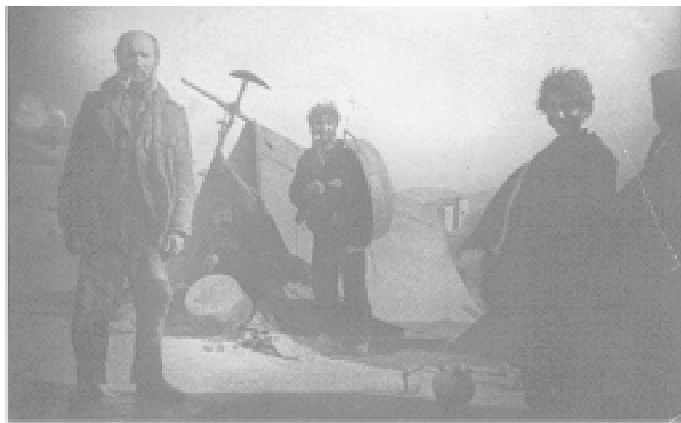
Fig. 14. Caldereros. 1904.

sus placas verascópicas-, pues gustaba de registrar -entre otras cosas- actividades comerciales desarrolladas en plena calle 41 . El sacerdote mallorquín Tomás Monserrat, por ejemplo, destaca por la fuerza de sus retratos de gente humilde 42 , pero a nuestro juicio -y sin pretensiones de grandilocuencia-, las fotos de Cerdá referidas a trabajos cotidianos, labores agrícolas y ganaderas y oficios artesanales superan con creces, por su técnica, pulsión emotiva