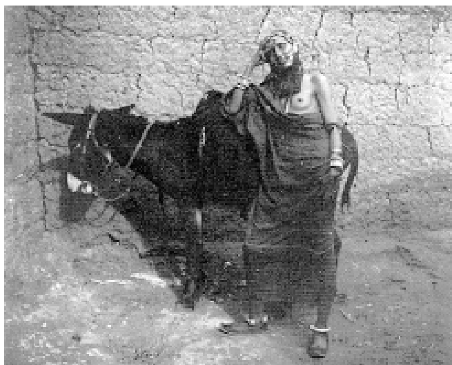
Fig.9. Mujer en Tánger . 1907.

La fotografía en color también fue practicada por Cerdá con éxito nada más nacer este procedimiento a principios del siglo xx, pues entre 1908 y 1912 tomará bastantes placas autocromas de retratos y bodegones. Las placas autocromas fueron un invento de los hermanos Lumiere que despertó muchas esperanzas entre los fotógrafos. La contemplación de estas instantáneas a través de una lupa como consecuencia de la técnica empleada- daba la sensación de estar viendo un cuadro puntillista de Seurat, por eso las reproducciones de