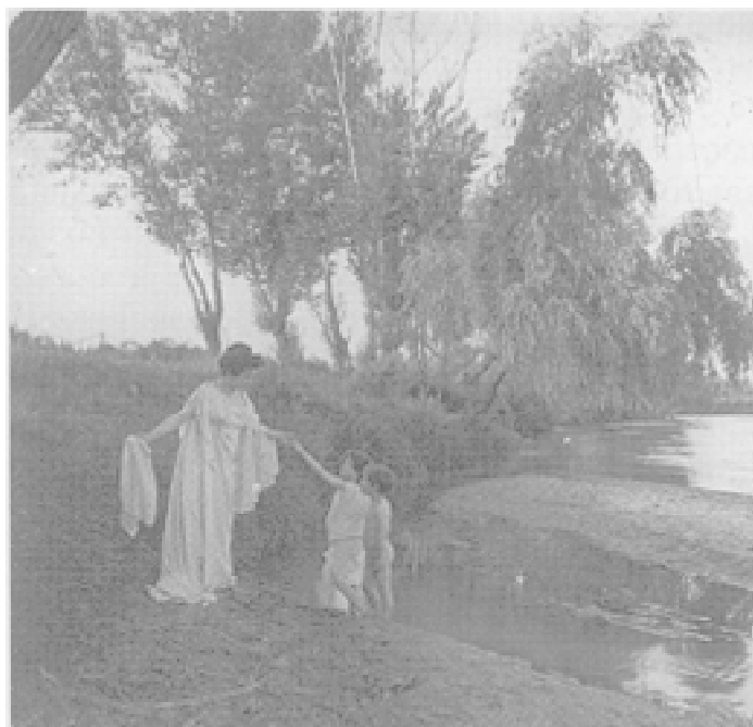
Fig. 3. Escena simbólica. 1906.