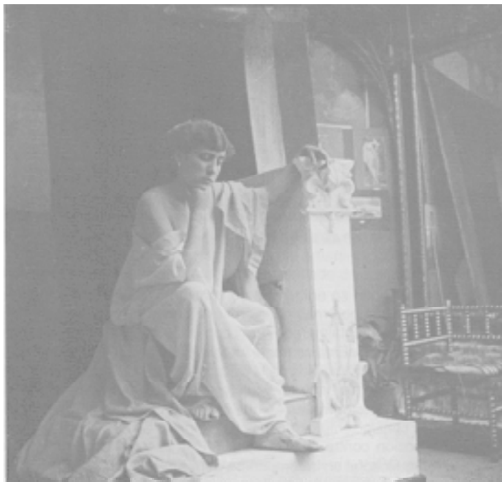
Fig. 2. Modelo en el estudio del pintor López Mezquita. 1905.