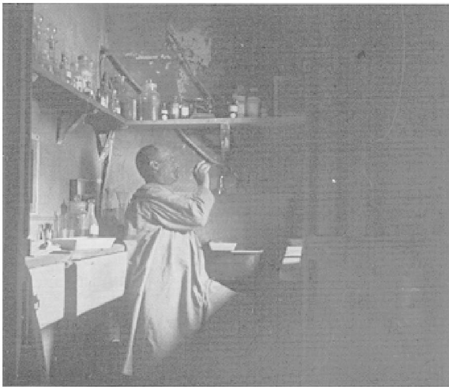
Fig. 1. Autorretrato en el cuarto oscuro. 1904

tes publicaciones 12 y la correspondencia cruzada con otros fotógrafos españoles, en la que éstos adjuntaban fotografías de su cosecha para que sus colegas las admirasen y conociesen su obra 13 . Todo esto suponía un limo vivificador para la producción de Cerdá, puesto que nunca se quedó encasillado ni se movió en el extrarradio de las más pujantes corrientes fotográficas. Así, por ejemplo, su faceta retratística, que consume una porción importante de sus instantáneas, denota el profundo conocimiento de la fotografía y pintura del siglo XIX, pues el arte de Daguerre, como es bien sabido, bebió hasta saciarse en las fuentes pictóricas, no sólo en su nacimiento sino en todo el resto de la centuria decimonónica. Aquí, por tanto, hay que hablar de sus autorretratos, pues en la bisagra del siglo XIX con el siglo XX, numerosos aficionados trasladan a la fotografía su propia imagen y se rodean de obje-