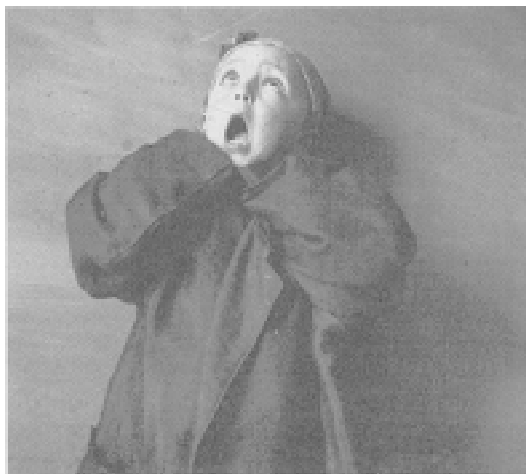
Fig. 6. Retrato de nieta. 1909.