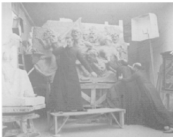
Fig. 5. Escena satírica. 1907.