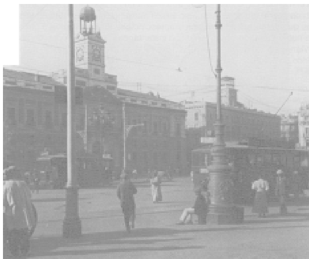
Fig. 12. Madrid, Puerta del Sol. 1905.

esta práctica 30 . Arturo Cerdá, cámara en ristre, viajó por varias provincias andaluzas -especialmente por Jaén, Granada, Córdoba y Sevilla-, Alicante, Valencia, Toledo, Madrid (Fig. 12), Salamanca, Ávila, Barcelona 31 , etc. E incluso registró fotográficamente ciudades de intenso cosmopolitismo como Venecia o París 32 , o enclaves del norte de África, debiendo destacar el extenso reportaje gráfico que realizó en la ciudad de Tánger en 1907 33 . Esta costumbre de los viajes fotográficos estuvo bien asentada en los operadores aficionados españoles, pues verbigracia Ramón y Cajal, aprovechando su estancia en 1899 en la estadounidense Universidad de Clark, en Worcester, tomó fotografías estereoscópicas. Sin ir más lejos, la revista La Esfera 34 creó la sección «España Artística y Monumental» con el fin de divulgar el rico patrimonio español, con lo cual se publicaban textos de viajes ilustrados con fotografías de monumentos, esculturas y obras pictóricas.