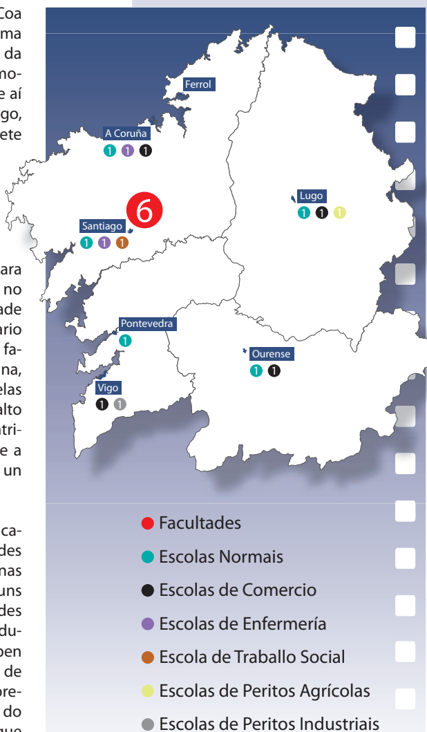
Figura 1 Centros universitarios e escolas de grao medio en 1970

O alumnado que acudía ás facultades, procedía de familias adiñeiradas, e era maioritariamente galego e masculino, pois non é ata o curso académico 1913-1914 cando por primeira vez aparecen matriculadas tres mulleres na Facultade de Ciencias, continuadoras do exemplo pioneiro das irmás Fernández de la Vega en Medicina. Tamén é feble a participación feminina no estamento docente, cando non testemuñal, ao haber unha única profesora impartindo clases a finais dos anos vinte.