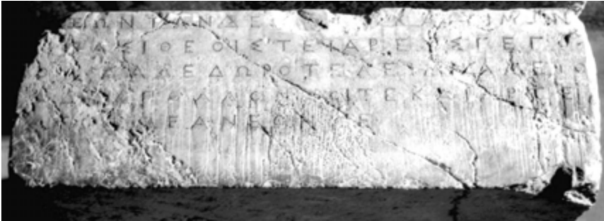
Figura 1. Inscripción N° 1, SEG 28, 1982, 746

Gran base de caliza gris azulada ( marmarópetra ), la cual fue descubierta en 1970 durante las obras de construcción de un edificio propiedad de Kontaxakis en el centro de la ciudad de Chania, cerca de la clínica Margariti. Se encontró desplazada cerca de un muro de cimentación de época romana perteneciente a una construcción que no ha podido ser reconocida. La base presenta dos textos: uno, grabado en el lado frontal, es una dedicatoria en verso a la tríada apolínea de la primera mitad del s. IV a.C. (Inscripción A) y el otro, grabado en el lado inferior de la base reutilizada, es una inscripción honorífica en prosa de finales del s. I a.C. dedicado a un tal Neocides (Inscripción B).