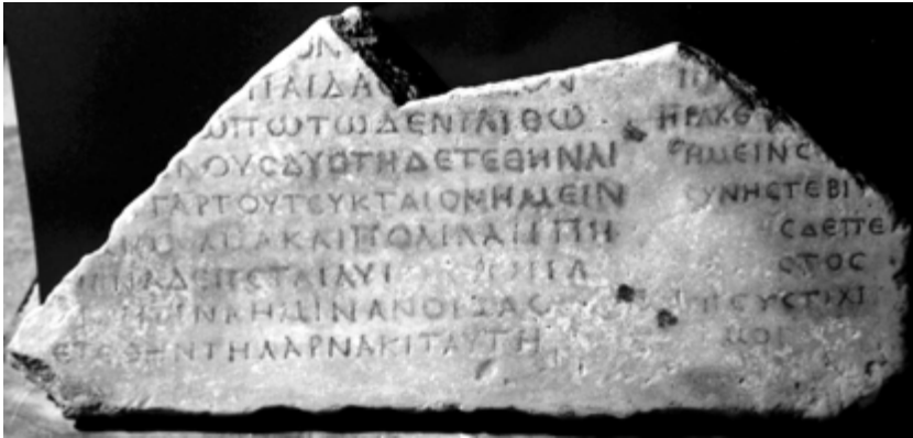
Figura 3. Inscripción N° 4, SEG 28, 1982, 748

Fragmento de una placa de mármol blanco, de grano fino, con dos inscripciones separadas; la inscripción de la derecha se ha perdido en su mayor parte (B). La otra inscripción, mutilada en su parte izquierda, es más prometedora (A). La placa, mutilada, pertenece a un sarcófago. La cara frontal está pulida. El cuerpo de las letras y su espaciado son ligeramente más grandes en la primera inscripción que en la segunda. Actualmente la placa se conserva en el Museo Arqueológico de Chania (N° de Catálogo E 97, Depósito de esculturas). He revisado (febrero 1994).