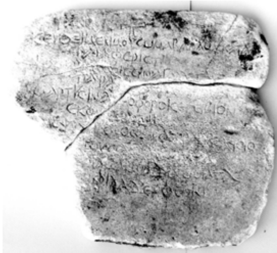
Figura 4. Inscripción N. 5, ICret. II, X, 21

Pequeña y delgada placa sepulcral de mármol blanco, encontrada en 1917 en Chania en el lugar denominado Agios Ioannis en el campo de Petr. Papisifakis. Posteriormente fue trasladada al Museo Arqueológico de Chania (Nº de catálogo E 44, y después E