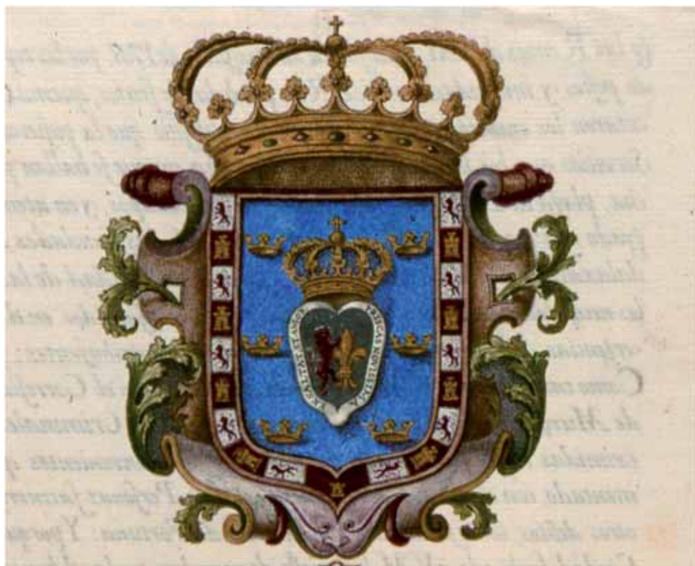
Escudo 1709 (Memorial)

LA ÚLTIMA Y SU CORRESPONDIENTE AMOR ENALTECE LAS CORONAS ANTERIORES.