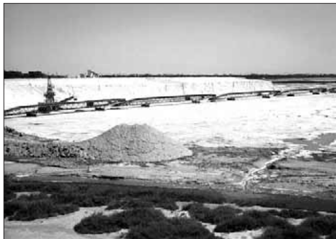
Salin de Giraud / JOSEPA BLANCH

Ara ja entrem de ple al delta del Rhône. És impressionant. La