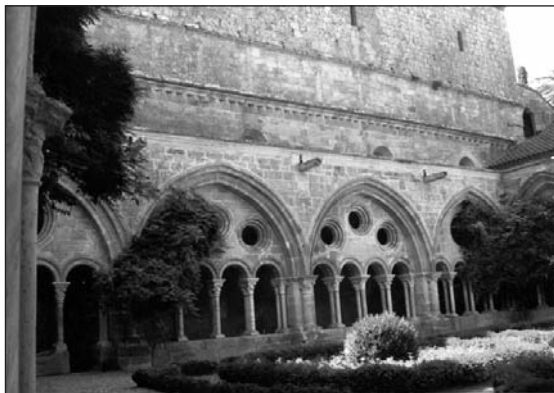
Abbaye de la Fontfroide / JOSEPA BLANCH