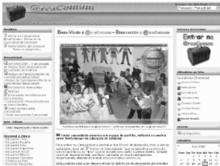
FIGURA 1 Página principal @rcaComum