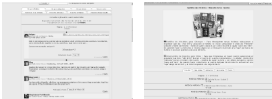
FIGURA 5 Para Intercambi@r...

Aquí encontramos diversas bases de datos, tales como “Material para preescolar”, este recurso está disponible con contenidos diversificados. Esta herramienta permite la introducción de archivos para quienes son administradores en la comunidad. Nos pareció que esto podría servir de apoyo al intercambio si los archivos fueran enviados al investigador responsable de la comunidad @rcaComum; con el transcurrir del tiempo este recurso pasó a ser menos utilizado pero aún contiene toda la información que se introdujo desde su inicio.