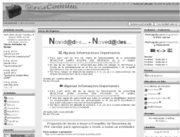
FIGURA 2 Noved@des...

A continuación, tenemos Entrevist@s (figura 3), sección que fue creada teniendo en cuenta que las entrevistas constituyen un instrumento de recolección de datos para nuestra investigación, siendo @rcaComum un proyecto en desarrollo, resultan oportunas como dinámica de las interacciones que se pretende para la comunidad. Para quien participa en este espacio y pretende conocer un poco del trabajo desarrollado en cada país iberoamericano, es una excelente forma de aguzar el interés de los participantes por nuevos descubrimientos, sobre prácticas en contextos de educación infantil.