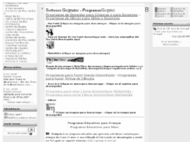
FIGURA 9 Programas gratis

Otra sección que sirve de apoyo y divulgación de herramientas tecnológicas es la que llamamos de “Programas gratis” (figura 9) donde divulgamos programas informáticos que pueden ser instalados gratuitamente en las escuelas, destinados a niños y educadores.