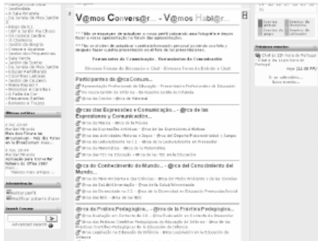
FIGURA 4 V@mos Habl@r