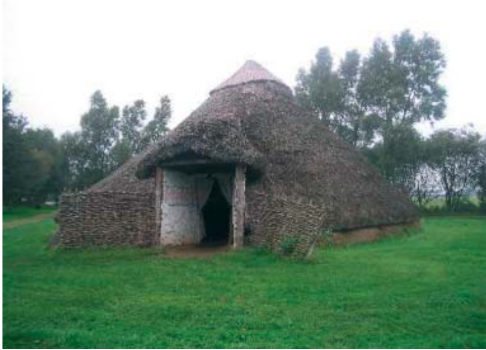
Casa reconstruida de Flag Fen- Iron-Age, Peterborough, England.

En el proceso de revalorización de los yacimientos británicos de la Edad del Hierro, un mecanismo muy común es la reconstrucción de los diferentes tipos de castros. Por ello es que proliferan las intervenciones de esta índole en yacimientos de poco tamaño, planteadas como un instrumento más para dinamizar desde un enfoque turístico y cultural una comarca rural concreta. De ello existen varios ejemplos en pequeña escala, y entre ellos se pueden destacar: Grimsby Project (Wise 1989) iniciado en 1986 para llevar a cabo la reconstrucción in situ de un asentamiento del Siglo I aC, ubicado en la región de South Humberside, co-financiado por tres instituciones locales y diseñado por investigadores del Museo local. Otro es Castell Henllys, en el Oeste de Gales, integrado en el Pembrokeshire Coast National Park.