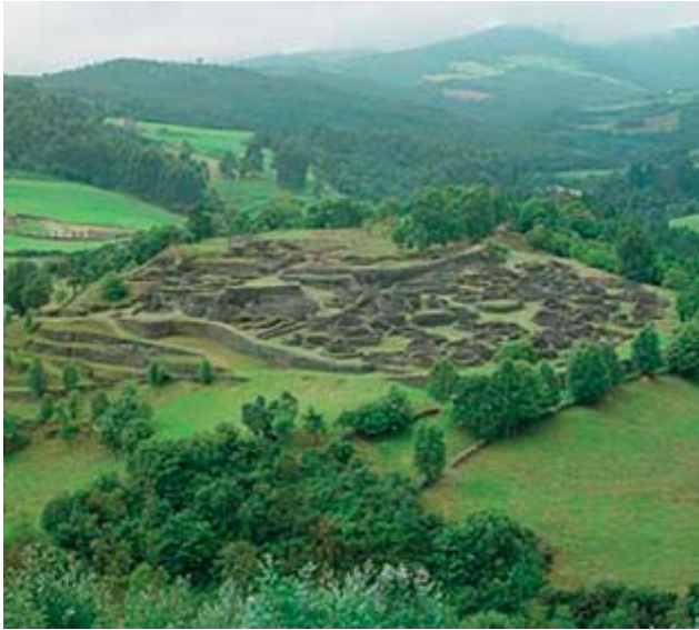
Castro de Coaña, Asturias.