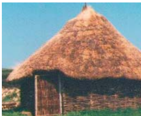
Butser Farm, Hants., Britain. Reconstrucción de casa varas de madera.