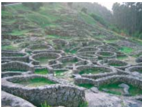
Castro Santa Tecla -Pontevedra, Galicia-. (Consellería de Cultura, Xunta de Galicia).

Parker-Pearson (1996:19). Mas aún no se ha llegado a obtener un consenso general acerca del motivo de esa orientación hacia el Este, que podía ser funcional, para atraer los rayos solares durante su rotación matutina y buscar protección contra la dirección de los vientos predominantes, o motivada por razones de índole simbólica y religiosa. Aunque algunos autores han mantenido que esa orientación tenía como función el evitar los vientos más fuertes, Parker-Pearson cree que las casas en «regiones célticas» eran redondas mientras la norma en el Continente Europeo era de casas rectangulares, para que la casa pudiera actuar como un microcosmos del universo; y la orientación hacia el Este pudiera haber