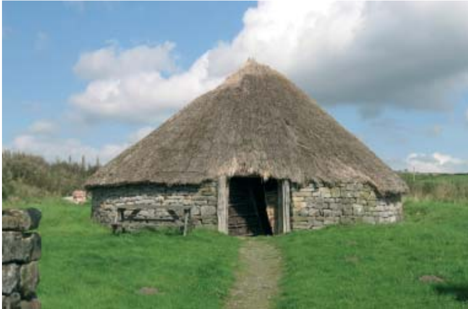
Brigantium, Redesdale, Northumberland junto al Muro de Adriano. Reconstrucción por Brigantium Arch Rec, Centre.

tradicionales, y de una gran cantidad de yacimientos arqueológicos y monumentos históricos. Por otro lado, paradójicamente, la necesidad imperiosa de reconvertir la base y las estructuras económicas de extensas regiones del territorio tras la desarticulación de la industria tradicional y el pase a la sofisticada era post-industrial, desarrollada en Londres y el Sur de la isla, ha incrementado el peso económico del Patrimonio en la economía británica, y paralelamente el interés en recrear componentes de ese Patrimonio con vistas a la creación de zonas y lugares turísticos atractivos, de recreo, y de actividades didácticas. Como reacción a ese proceso, la Administración británica impulsó la creación de una política patrimonial que a partir de 1983 fue asignada en parte a la entidad conocida como English Heritage, para gestionar el Patrimonio Arqueológico Histórico de propiedad estatal. Años después fueron creadas entidades semejantes para Escocia y para Gales. English Heritage ha dedicado sus mayores esfuerzos a la divulgación del conocimiento arqueológico e histórico, promocionando nuevas políticas expositivas encaminadas a la presentación de yacimientos y monumentos a un público cada vez más interesado en contactos directos con el pasado.