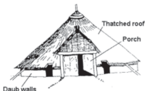
Casa redonda céltica, Gales (dib. anónimo).

diseñado por Peter Reynolds (1979) en Butser Farms, Hampshire. Ambos proyectos constituyen un buen ejemplo de las tendencias y estrategias de puesta en valor planteadas por la Arqueología británica desde los años 70. En ellas se han integrado talleres experimentales, no sólo para propulsar la investigación básica, sino también como marco para el desarrollo de actividades participativas por parte del público que visita las reconstrucciones, ya que éstas se conciben como una valiosa herramienta para la divulgación y comprensión por parte de los visitantes de esos yacimientos.