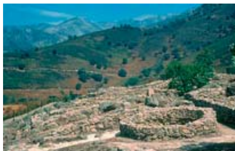
El Raso, Candeleda, Ávila, siglos II-I adC. (Foto Álvarez Sanchís).

ahora han sido detectados cinco ejemplares en Escocia, tres en Gales, y algunos en la Isla de Man (Herity and Eogan 1977:228). Harbison (1971), señala al respecto que puede haber habido muchos más construidos de madera, que no han sobrevivido. En la Península Ibérica han sido descritos sistemas defensivos de piedras hincadas en varios lugares: Passo Alto, Portugal (Soares 1986); en Zamora (Esparza 1987: 248, 358ss); en los castros El Pico de Cabrejas del Pinar, y Alto del Arenal de San Leonardo en la provincia de Soria (Romero 1991: 210ss y 495); Castrejón de Capote, Higuera la Real, Badajoz, (Berrocal-Rangel 1991:191); en el Alto Duero (Jimeno y Arlegui 1995); y Harbison (1968) enumera varios de ellos a lo largo de la Península. Concretamente en Celtiberia y territorios anejos, han sido halladas piedras hincadas ante castros de su zona más occidental, en el Norte de las provincias de Cuenca y Guadalajara (Lorrio 1997:90). Hallazgos importantes de este tipo son los de Castilviejo de Guijosa, Sigüenza (Belén, Balbín y Fernández Miranda 1978), Hocincavero, Anguita, Guadalajara (Barroso y Díez 1991). Y han sido detectados también