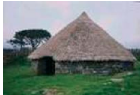
Casa reconstruida de la Edad del Hierro en Gran Bretaña.

Estas empresas a pequeña escala siguen la pauta marcada por dos proyectos que han impulsado notablemente la investigación sobre la Edad del Hierro en Gran Bretaña durante las últimas décadas: la excavación intensiva y sistemática de Maiden Castle, Dorset (Wheeler 1943; Cunliffe 1974: 161-66), y el programa de Arqueología Experimental