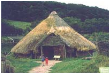
Butser Farm, Hants, Britain.

Desde la década de los 1970 se ha venido manteniendo en Gran Bretaña un interesante debate de fondo arqueológico sobre el concepto, naturaleza y utilización social del Patrimonio Histórico. Este ha sido uno de los países pioneros en el planteamiento de políticas de gestión y en el diseño de estrategias de interpretación del Patrimonio, una circunstancia que refleja el ingente interés y demanda de pasado de una sociedad que ha vivido sucesivos procesos de industrialización, con la consecuente desaparición de modos de vida rurales,