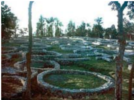
Castro de Povo do Varzim, Portugal.