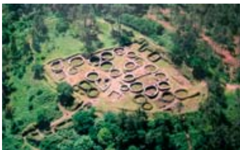
Borneiro -A Coruña, Galicia-.

término celta, en este caso Cultura Céltica del NO de la Península Ibérica, que es el que en realidad le corresponde, ya que celtas eran quienes construyeron esos castros y esas casas, redondas antes de la llegada de los romanos y cuadrangulares después. Y celta era toda esa región: Galicia, Asturias occidental, el NO de León y el N de Portugal (Alberro and Arnold 2003-2008). Y en todo caso, Cultura Castrexa (Castreña en castellano), indica Cultura de los Castros, y castros existieron y aún se pueden ver no solamente en esa región, sino también en