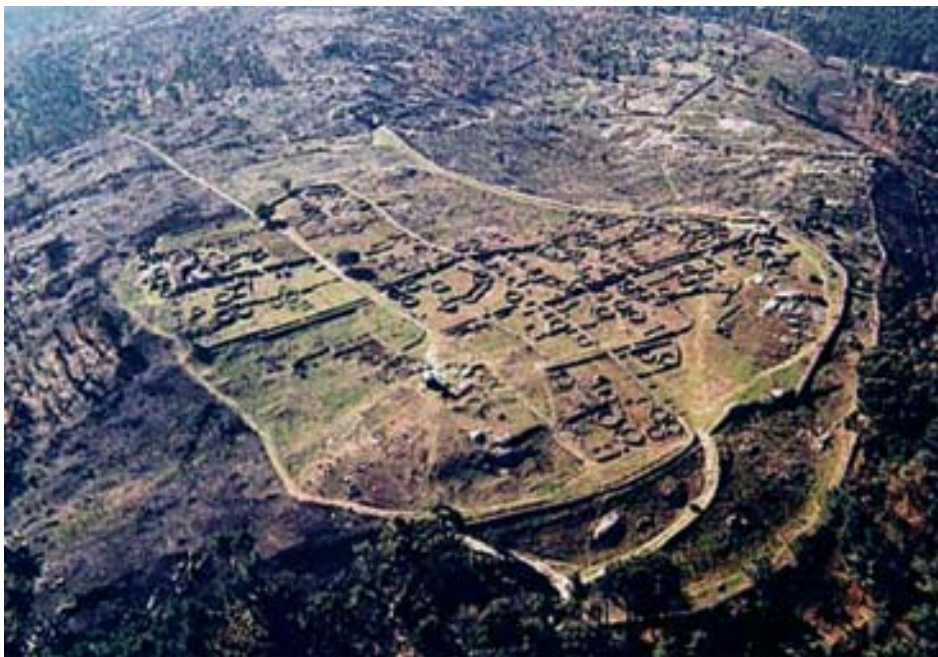
Castro de Sanfins, Paços de Ferreira, Portugal (Silva 2002).

Otro término para designar a un castro sobre un promontorio bordeando el mar es cliff castle , castillo en un acantilado bordeando el mar, protegido por varias líneas de defensa en el angosto pasaje o «cuello» que une al istmo con la parte principal del territorio. En la Península inglesa de Cornwall y en el NO de Devon es también común el round , que en muchos casos contiene en su interior cabañas redondas.