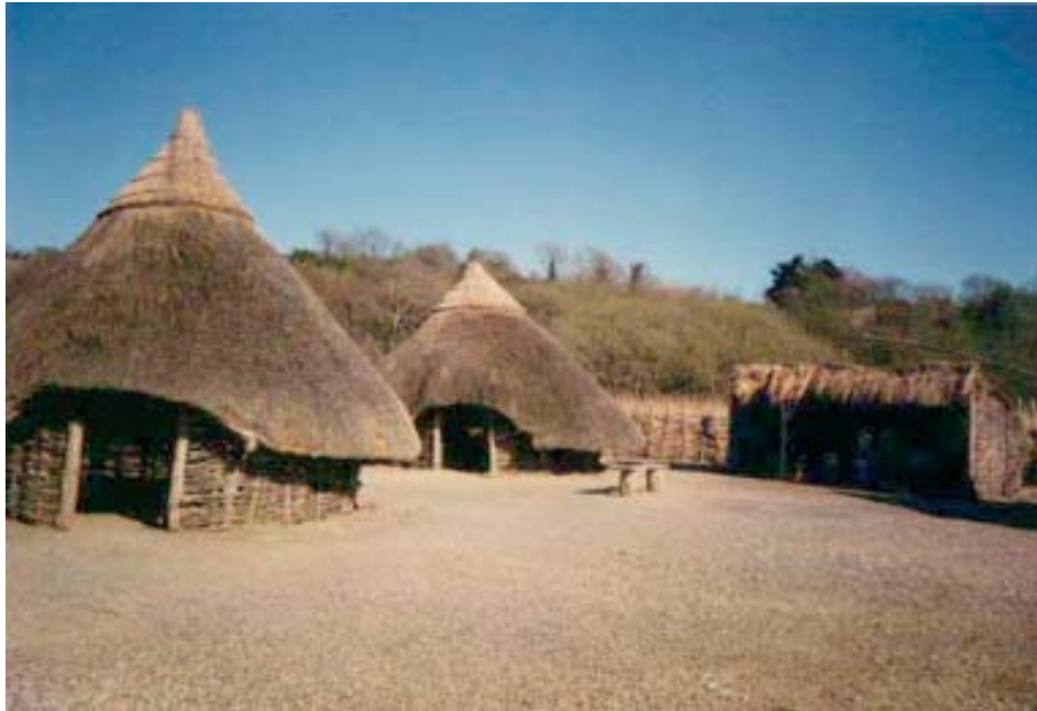
Castell Henllys (Pembroke Coast Nat, Park, Gales).