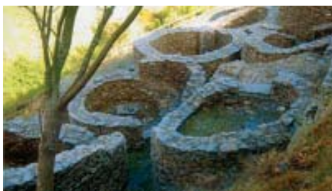
Castro de Chano, NO de León.

como vitrificados, que muestran señales evidentes de que las maderas de enlace fueron extensamente quemadas, lo que causó que el material del centro de la muralla se muestre ahora descolorido y fundido. Ejemplos de ellos son Finavon y Monifieth en Angus, y Castle Law, Forgondenny, Perth. Lo que no se ha podido determinar aún es la causa de esa vitrificación: si las quemaduras han sido realizadas en forma deliberada por los constructores tratando de consolidar la muralla, o son debidas a incendios provocados por fuerzas atacantes (Mac Kie 1976).