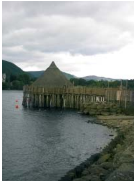
Crannog, Lock Tay, Perts, Escocia.

También ha sido sugerido por varios autores un componente procedente de la Península Ibérica en la génesis de los castros irlandeses del S de la isla, con base en las defensas tipo chevaux-de-frise (piedras hincadas) como las de Dun Aengus en las Islas Aran, y otras