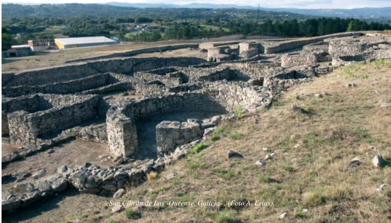
San Cibrán de Las -Ourense, Galicia-.