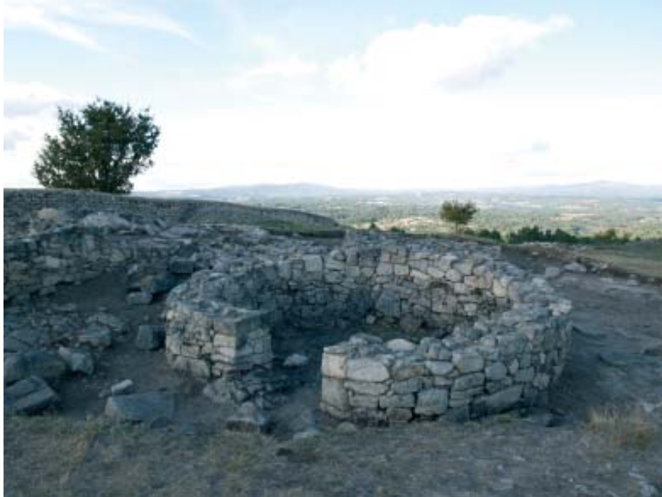
San Cibrán de Las -Ourense, Galicia-.