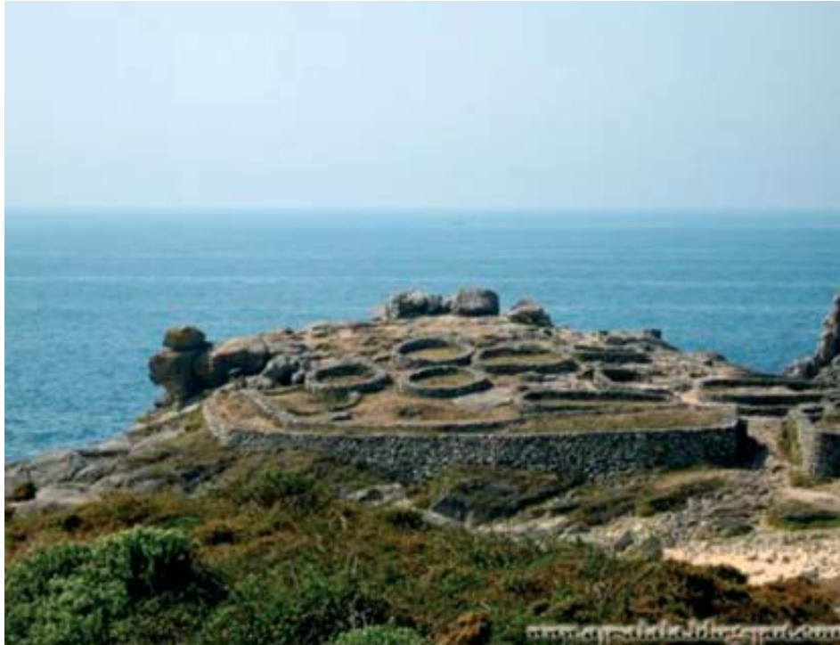
Castro de Baroña -A Coruña, Galicia.