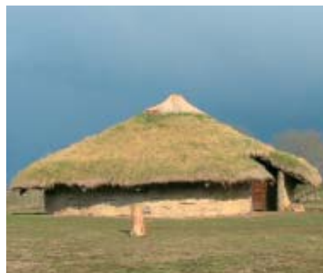
Casa reconstruida en Flag Fen, Peterborough, England.