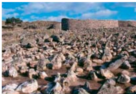
Piedras hincadas (Chevaux-de-frise) ante el Castro Las Cogotas, Ávila.

en Yecla de Yeltes, Salamanca, y en algunos castros de NO peninsular como el de Cidá do Castro de San Millán, en Cualedro, comarca de Verín, Galicia, y en El Picu da Mina, y San Isidro en Asturias. Un hallazgo singular es el de Els Vilars, Lérida, por estar situado en una antigua zona ibérica, no céltica, y que data probablemente del Siglo VII aC (Garcés et al 1991 y 1993). Defensas de este tipo han sido halladas también en Irlanda: Dun Aengus y Dun Dubhcathair, en las Islas Aran; Ballykinvarga, Co. Clare; y Doonamo, Co. Mayo. De hecho, aparte de algunas líneas de defensa de este tipo, pero de madera, descubiertas en Alemania y en Francia (Pech-Mahoo y Fou de Verdun), solamente han sido detectados chevaux-de-frise de piedra en la isla de Gran Bretaña, Irlanda, y la Península Ibérica.