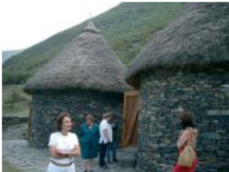
Casas reconstruidas en Castro Chano, León.