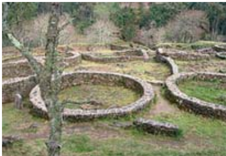
Borneiro -A Coruña, Galicia-.

Oswald (1997) recalca también que la orientación de las puertas de entrada pudiera poseer elementos místicos, y la importancia de todo ello podría ser considerada como un componente de la visión general propuesta por algunos autores de que en las sociedades tradicionales los edificios incorporan metafóricamente básicos principios sociales y cosmológicos (Tuan 1977; Parker Pearson and Richards 1994; Cunningham 1973: 235), una opinión exagerada según otros autores.