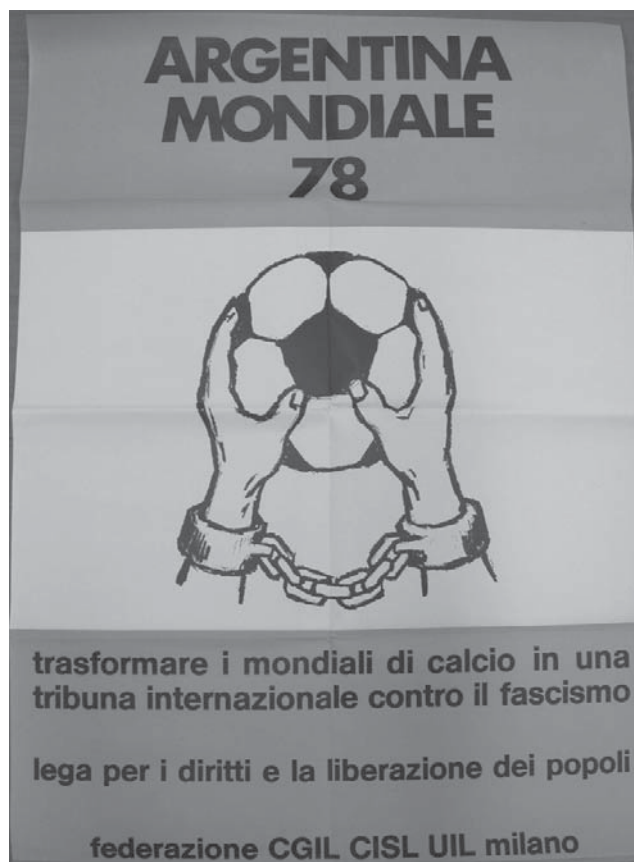
Cortesía de la BDIC. Nanterre.