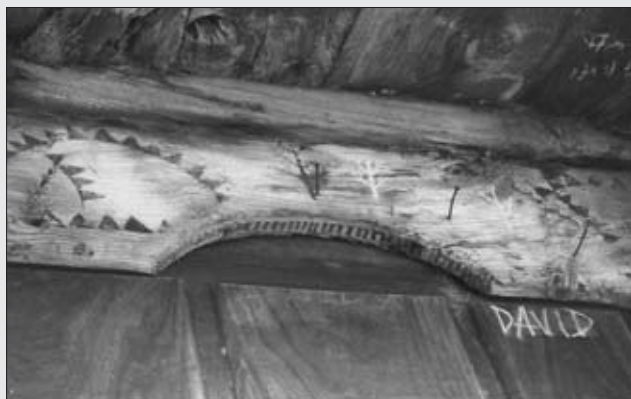
HÓRREO DE CASA FAUSTA. PREMOÑO.

FRANCISCO DE SAMA , vecino de Premoño. Ganados: cabrío: 2, de cerda: 1 y otros recibidos en aparcería.