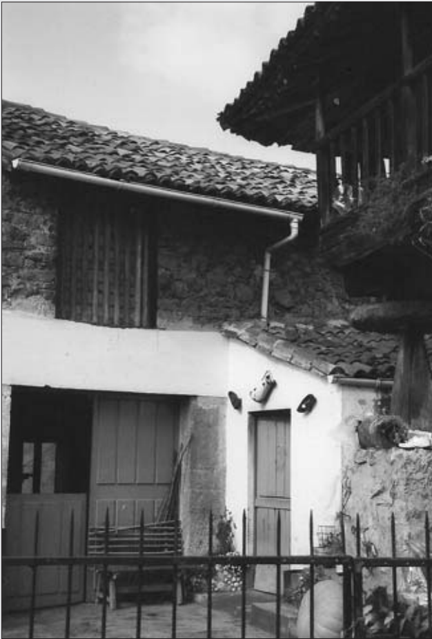
CASA DE PORTAL Y PAJAR REFORMADA. FOTO LUCÍA MARTÍNEZ

Rubiera (robles) . Ganados: vacuno: 6, de cerda: 1 y colmenas. Tiene un molino de desergar que su utilidad son tres copines de pan cada año.