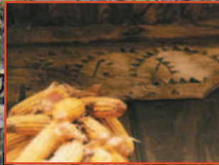
Los hórreos con decoración pintada en el concejo de Les Regueres