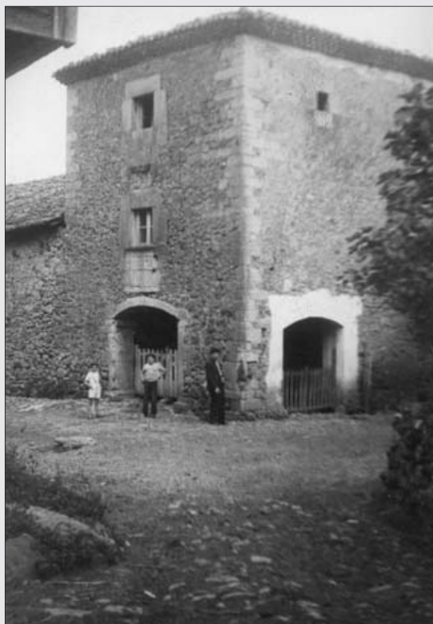
LA PORTALADA, 1952.

La Portalada es llamada así por tener 2 portales, al igual que otros edificios en el concejo, como La Portalada en Mariñes o en Quexu. Después del palacio de Bolgues, es el edificio con más empaque en la época, el único que tiene 3 pisos. Tiene una planta de