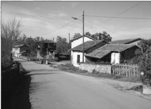
CASAS TRADICIONALES Y HÓRREO.