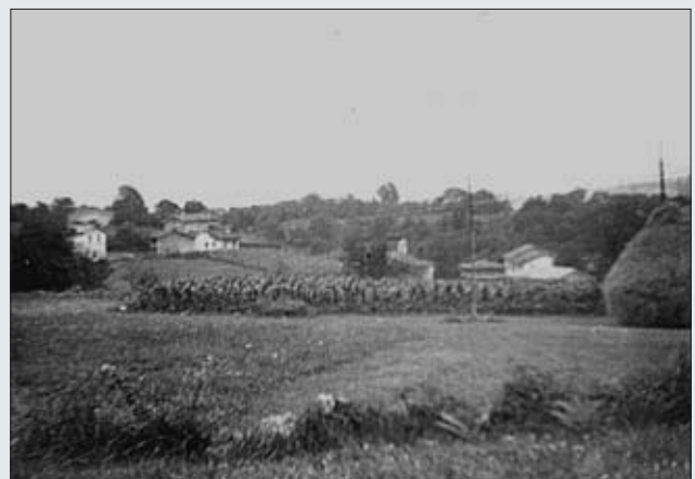
VISTA GENERAL DE PREMOÑO, 1958.