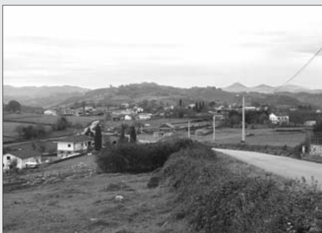
VISTA PARCIAL.