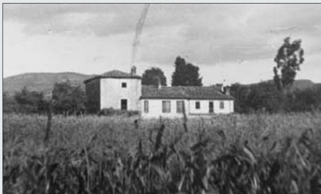
LA PORTALADA, 1951.

La casa de La Portalada pertenece a la familia Miranda desde que se fundó. Queda claro, por tanto, que este no es el hospital.