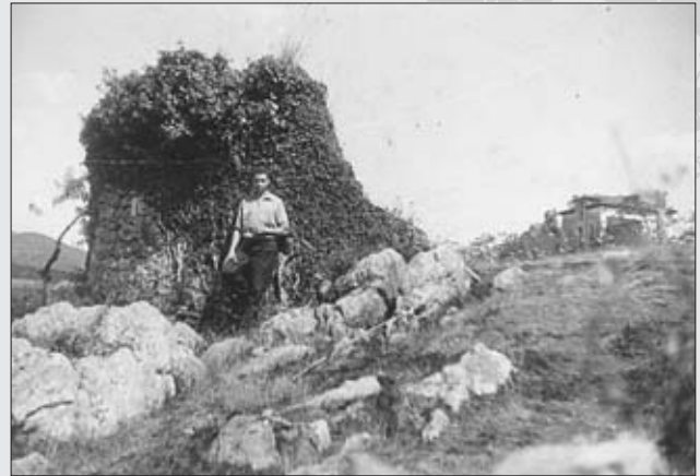
EL PALOMBAR, CASA XILO. 1957.