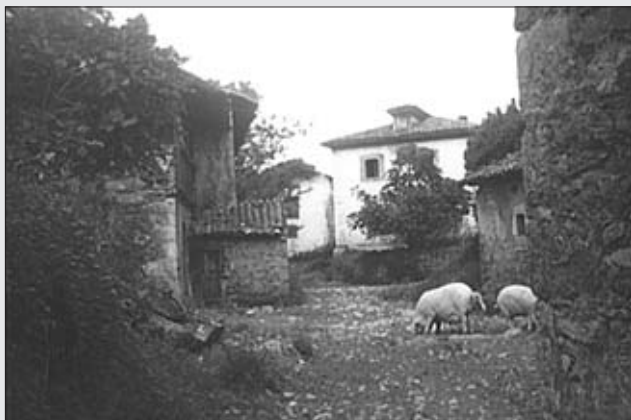
LA CAI, PREMOÑO, 1958.