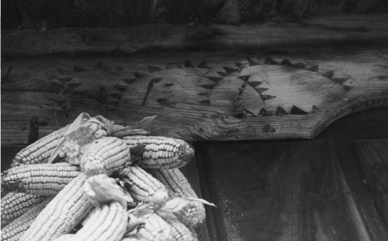
HÓRREO DE CA FAUSTA. FOTO LUCÍA MARTÍNEZ