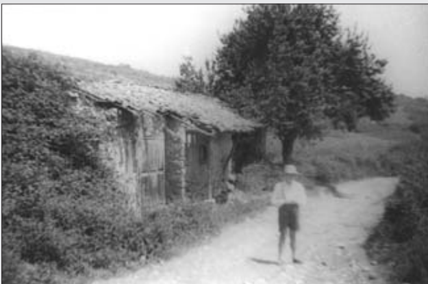
CASA DEL FIXUECO, AL PARECER ANTIGUA VENTA. 1958.