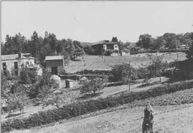
AL FONDO LA CASA DONDE VIVÍA EN RENTA EL CURA DE VALDUNO, (LA CASA DE RECTORÍA ESTABA EN PEREDA) DE AHÍ QUE TOMARA EL NOMBRE DE LA RECTORAL. 1951.

Laguna, El Praduco, Las Bragadas y El Costazo. Castañedos: La Portalada, El Arenal, El Rollo. Lleva en arriendo Francisco de Sama, vecino de Premoño en 5 fanegas de pan.