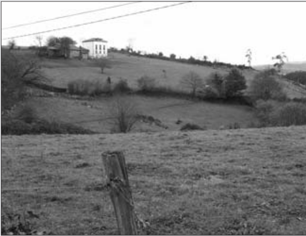
BARRIO DE LA PINIELLA.