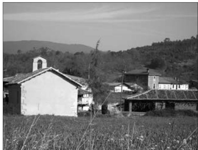
VISTA PARCIAL DE PREMOÑO.

Al tiempo que transcribíamos la información aportada por las respuestas particulares del CME, ya nos llamaba la atención la tipología de las casas, abundaban las altas y con varias estancias o dependencias. Esto podría deberse a una nobleza de segundo orden entre los vecinos y propietarios, como el caso de la familia Miranda, los Solís, los Granda, o los Fernández Argüelles, que poseen buenas edificaciones, como veremos más adelante, pero otros vecinos que no pertenecen a esta clase social, también poseen casas que están por encima del nivel medio del concejo.