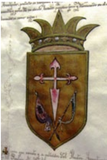
Escudo del Realejo Alto. 1929.

(53) Rodríguez Mesa, 1980: 126-127 (nota 5).