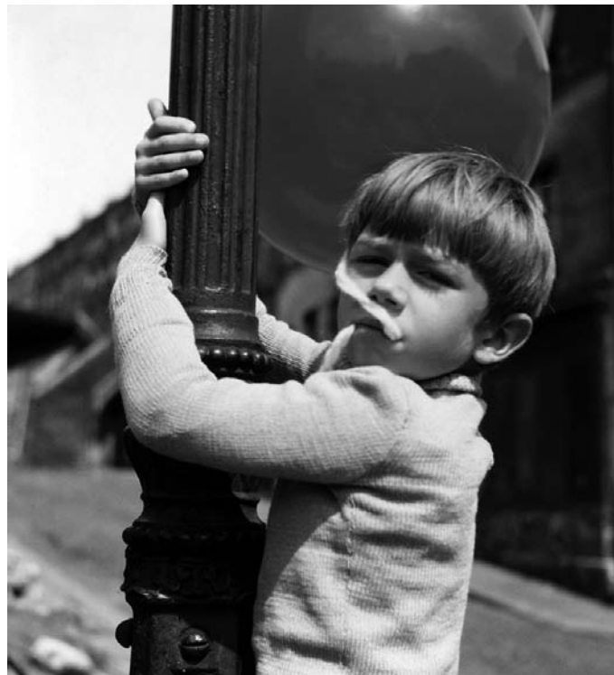
Un fotograma de Le ballon rouge (1956)

El seu següent migmetratge fou el captivador Le ballon rouge (1956, El globo rojo ). Té força punts en comú amb Crin blanc: le cheval sauvage . En aquest cas s'explica la història d'un nen que