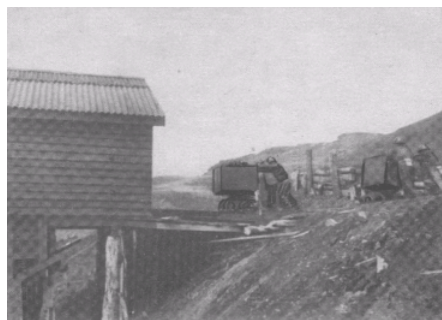
En los yacimientos de carbón de Río Turbio, territorio nacional de Santa Cruz, se trabaja intensamente refirmando la independencia económica argentina.

trata de una reproducción de la serie “Argentina en marcha” de la Subsecretaría de Informaciones de la Presidencia de la Nación. El epígrafe dice: “El gasoducto “Presidente Perón”, es una