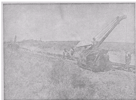
El gasoducto "Presidente Perón" es una magna obra de la Nueva Argentina que muestra la potencialidad industrial alcanzada en la era justicialista. Reproducción de "Argentina en marcha", publicación de la Subsecretaría de Informaciones de la Presidencia de la Nación.

magna obra de la Nueva Argentina que muestra la potencialidad industrial alcanzada en la era Justicialista”.