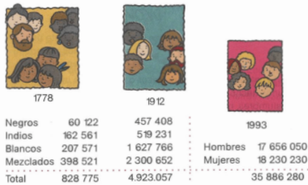
Ilustración No 2

Esta ilustración, aparece en el texto Horizontes Sociales de la editorial Prentice Hall del año 1999 y muestra otro tema de recurrente complejidad en los textos escolares, y en general para la historiografía de este país: el asunto de los censos coloniales, razones como la vasta geografía, los numerosos grupos que conformaban el mundo colonial, la influencia del clima en las características de las personas, serán esgrimidos como razones que impidieron tener datos exactos y fiables sobre las gentes de todos los colores . Podría utilizarse esta lámina para contar las paradojas de los cruces y combinaciones realizados en ¿una especie de pacto genético? por flexibilizar la situación colonial.