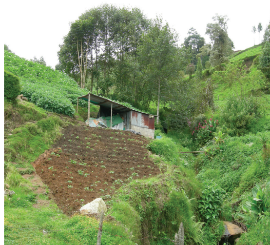
Fig. 2. Cultivos en pendientes elevadas en la cuenca del río Birrís.