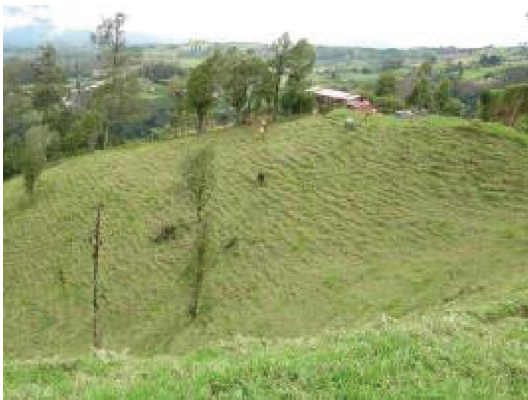
Fig. 4. Potrero con escalonamiento por sobrepastoreo.

La similitud de factor C en potrero en carga normal y potrero degradado (Cuadro 5) se debe a que ambos presentan una cobertura casi completa. Sin embargo, el potrero degradado tiene una carga ganadera mayor, con una mayor compactación del suelo, cuyo efecto en la erosión está compensado por la alta rugosidad del escalonamiento característico (Figura 4) y la baja densidad de los andisoles.