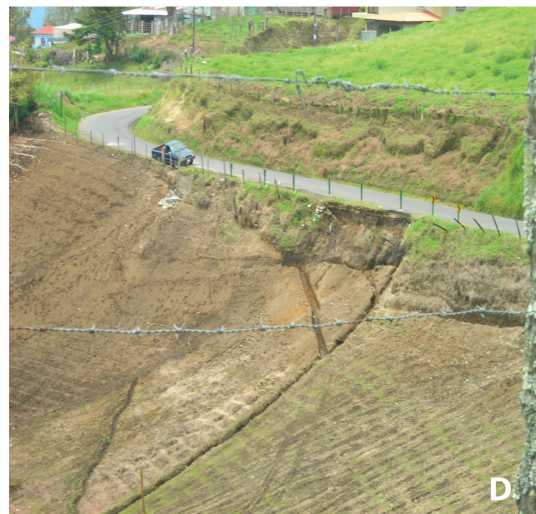
Fig. 3. Indicadores visuales de erosión en la cuenca del río Birris. A. Pedestales. B. Raíces desnudas. C. Cárcavas. D. Movimientos en masa.