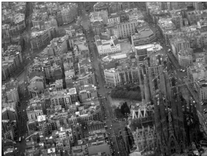
La Sagrada Família de Barcelona

Tres trames entrelligades que fins i tot defugen els tòpics narratius. Vaja, que no s'entrelliguen en els punts que el lector —víctima de milers de trobades previsibles que omplen novel·les de pèssims autors— s'imagina sinó, sobretot, de manera inesperada. La primera, la protagonitzada pel Damià Darder i per la seva filla Sara (altrament anomenats Fugitiu de la sequera , igual que Zac, el gos fidel), d'una intensitat emocional ben notable, no acaba desllorigant el problema final com esperaria més d'un i, tot i així, es reprèn més enllà de la novel·la amb gran força, bàsicament en el pensament d'uns lectors més engrescats que mai a imaginar com continuen unes peripècies vitals capaces de sobreposar-se a unes situacions límit que no paren de posar a prova la seva resistència física i emocional.