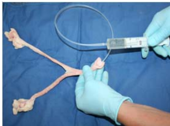
Figura 5. Tratamiento 3. No se realizó ninguna incisión del útero. El medio de lavado se introdujo y los oocitos se recuperaron a través de un catéter Tomcat 8Fr de 56 cm de longitud introducido al útero transcervicalmente.

Los oocitos recuperados de cada perra, se colocaron en una caja de Petri para ser