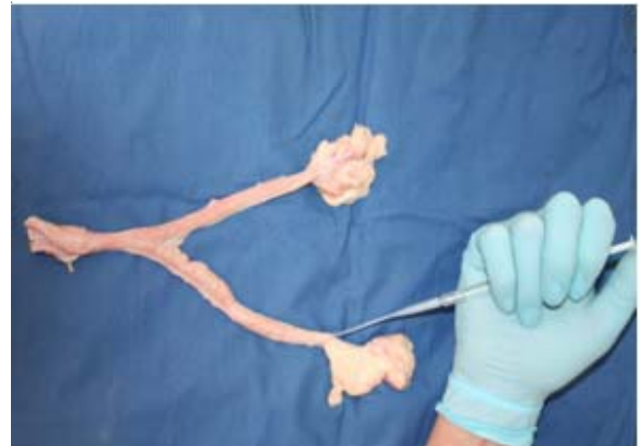
Figura 2. Colocación de 10 oocitos desnudos en el extremo ovárico del cuerno uterino.

Se introdujeron 10 oocitos desnudos (sin capas de cumulus) en cada cuerno de los úteros extraídos de hembras caninas post mortem. La introducción se realizó en el extremo ovárico de cada cuerno del útero. Con una aguja de calibre 20 se perforó el útero para permitir el paso de un catéter TOMCAT 8Fr, el cual contenía los oocitos. Después de introducir el catéter, se vació su contenido en el lumen del cuerno (Figura 2).