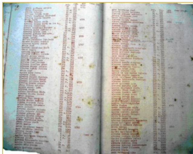
Imagen de las páginas 2 y 3 del Índice General de Bautismos de la parroquia de San José de Jatibonico y Arroyo Blanco hecho en 1945.