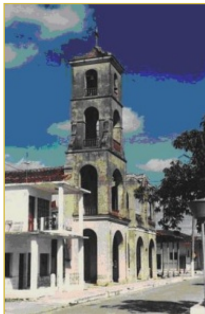
Templo parroquial de Jatibonico en la calle de Céspedes, también conocida como la "Carretera de Arroyo Blanco".