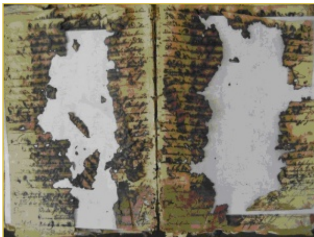
Imagen del deplorable estado en que se encuentran hoy los folios iniciales del primer libro de bautismos de la antigua parroquia de San José de Arroyo Blanco, con sede en Jatibonico, Sancti Spiritus. (Foto del autor, abril de 2007)

página por página y folio tras folio, con el simple uso de una cámara digital y de un ordenador portátil. 13 De este modo, ahora sigo un lento proceso de elaboración de un Índice general Sacramental de todo el archivo parroquial de San José, 14 que abarca los casi 95 años de la presencia inicial de la parroquia en su primitivo lugar de origen en Arroyo Blanco desde 1819 y otro siglo desde su traslado hacia Jatibonico entre 1912-1915. El total de libros escaneados ha sido de 50 tomos, con uno en muy mal estado de conservación por el deterioro corrosivo de la tinta que ha provocado la pérdida de cerca de 50 folios, lamentando que otros 3 libros se hayan deteriorado del todo, resultando imposible su digitalización. 15 En total, incluyendo, los registros contenidos en los libros perdidos, -de los cuales existe el índice realizado en 1944-45 por el archivero Alfonso Sariego Burgos, bajo la supervisión y con la colaboración del párroco David Centelles Orti-, se pueden contabilizar más de 53.000 asientos en 190 años.