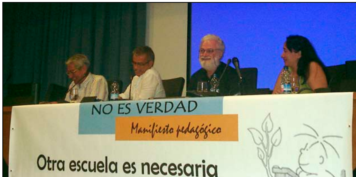
Presentación del Manifiesto en Sevilla.

Sobre los contenidos del Manifiesto No es verdad de la red IRES subrayo dos puntos principales: