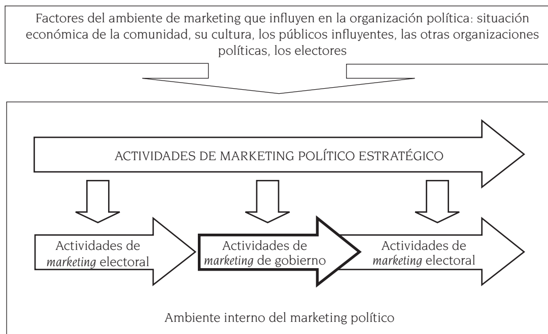
Gráfico 1: Ubicación del marketing de gobierno