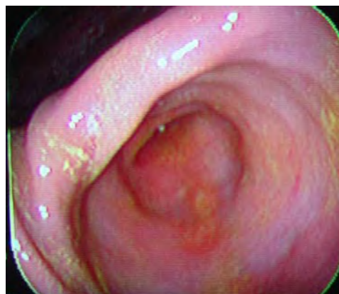
Figura 1. Videoendoscopia gástrica. Antro pilórico de un paciente canino con gastritis crónica severa y afectado por Helicobacter spp.

Para la endoscopia se utilizó un fibroendoscopio flexible Pentax® con una longitud de 105 cm, un diámetro externo del tubo de inserción de 9.0 mm y diámetro del conducto de 2.8 mm. Las biopsias se obtuvieron mediante pinzas estándares para biopsia endoscópica. En cinco casos se realizó el procedimiento utilizando un video endoscopio Pentax® (véase Figura 1). Se tomaron en promedio 3.5 biopsias por paciente, y sólo se incluyeron en el estudio los pacientes que tuvieran al menos una biopsia tanto del cuerpo como del antro gástrico.