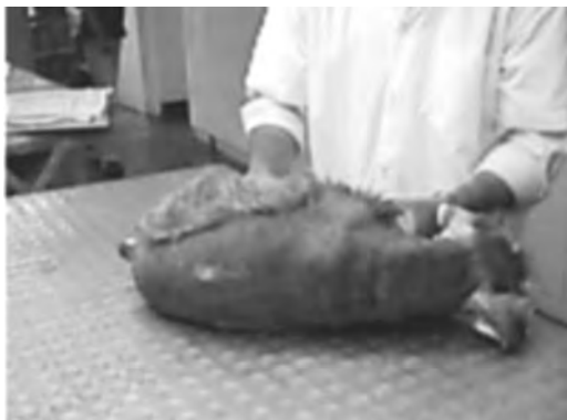
Figura 1. Paciente 1 mostrando incapacidad para incorporarse y desplazarse primer día de consulta.

en el miembro torácico del mismo lado, 2) a la valoración neurológica, se encontró hemiparesis derecha, incapacidad para incorporarse, parálisis espástica del miembro pélvico derecho con presencia de dolor superficial y profundo en los cuatro miembros, reflejo del panículo inexistente sobre el lado derecho (véanse Figuras 1-5), 3) las reacciones posturales (carretilla, sostenimiento de peso, salto, hemisalto etc.) se encontraron anormales en los miembros torácico y pélvico derecho, los reflejos espinales del miembro torácico derecho se encontraron en +1, los reflejos espinales del miembro pelviano izquierdo estaban en +3, los reflejos espinales de los miembros izquierdos se encontraron normales +2. Los resultados del examen neurológico, sugirieron la localización de la lesión a nivel de C6 a T3. La palpación de la columna vertebral no evidenció dolor. Los diagnósticos diferenciales tenidos en cuenta fueron: neoplasia, meningomielitis infecciosa, trauma, discospondilitis y enfermedad discal.