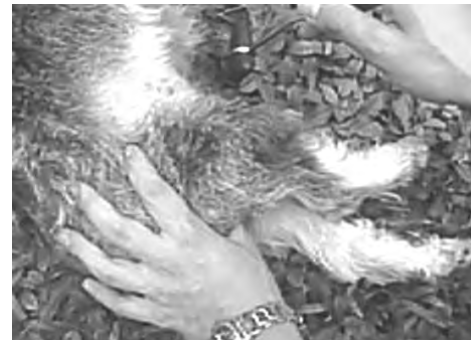
Figura 4. Paciente que muestra recuperación de la capacidad de locomoción, aunque continúa el déficit de apoyo en miembro torácico derecho (3 días después de la consulta)