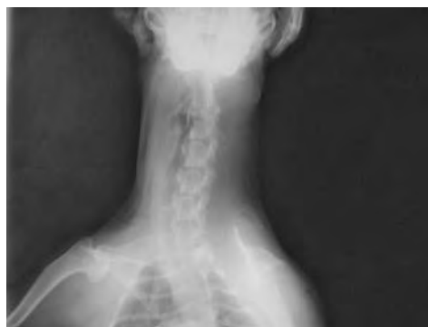
Figura 6. Radiografía ventrodorsal del paciente 2 sin evidencia de lesión.

Para el Plan diagnóstico se recomendó realizar un estudio radiológico simple de columna cervicotorácica (véanse Figuras 6 y 7), análisis de líquido cefalorraquídeo, y mielografía o tomografía computarizada, o ambos. De los exámenes requeridos sólo se realizó la radiografía simple debido a que el propietario no contaba con los recursos económicos suficientes; la radiografía no reveló cambios en la densidad, posición, contorno o arquitectura a nivel de disco intervertebral o vértebras. El diagnóstico tentativo al igual que con el paciente N° 1 fue el de infarto fibrocartilaginoso (IFC), lo que obedeció a características como: la aparición aguda y no progresiva del cuadro, el compromiso hemilateral, la ausencia de dolor a la palpación de la columna vertebral, los anamnesicos, y la raza y edad del paciente.