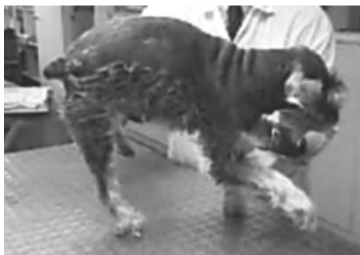
Figura 2. Paciente 1 evidenciando parálisis espástica de miembro pelviano derecho, incapacidad de apoyar en miembro torácico derecho (día 1).