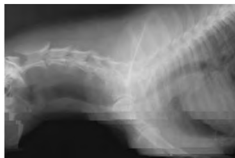
Figura 7. Radiografía latero lateral del paciente 2 sin evidencia de lesión.