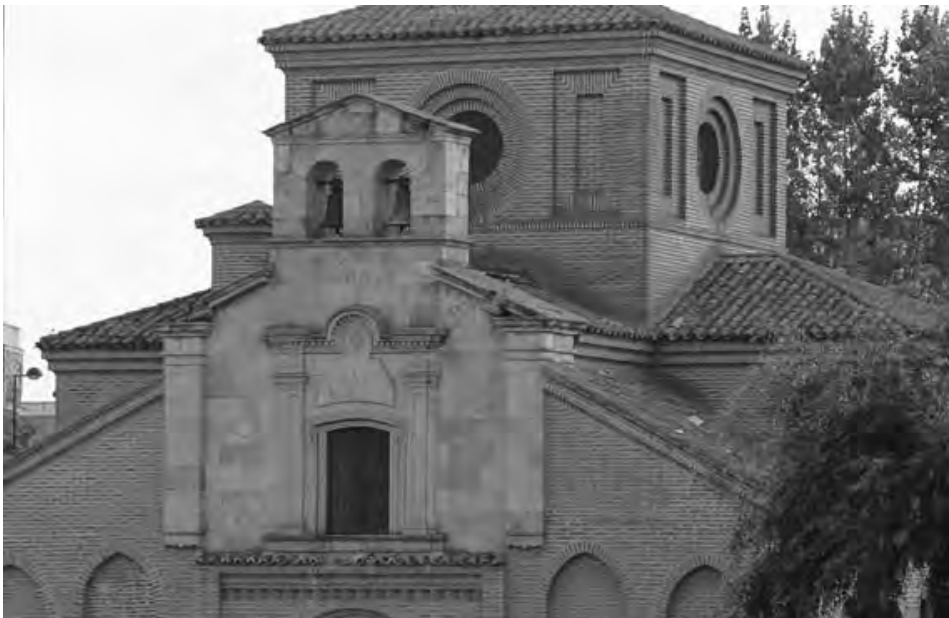
Fig. 4. Espadaña.